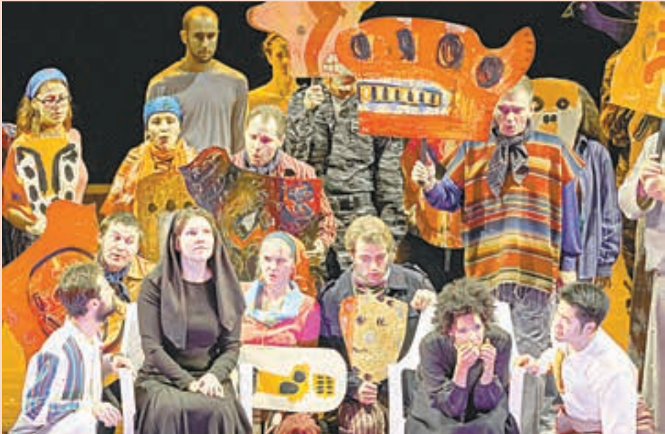
Пермский театр оперы и балета, 25,27,28,29 сентября, 1 и 2 октября, 19.00

Главные партии в спектакле исполняют приглашённые международные оперные звёзды и солисты Пермского театра оперы и балета, массовые сцены исполняют артисты хора MusicAeterna. Причём, как подчёркивает режиссёр, одни и те же артисты будут петь и партии индейцев, и партии испанцев, что позволит им самим изнутри постановки прочувствовать трагедию.