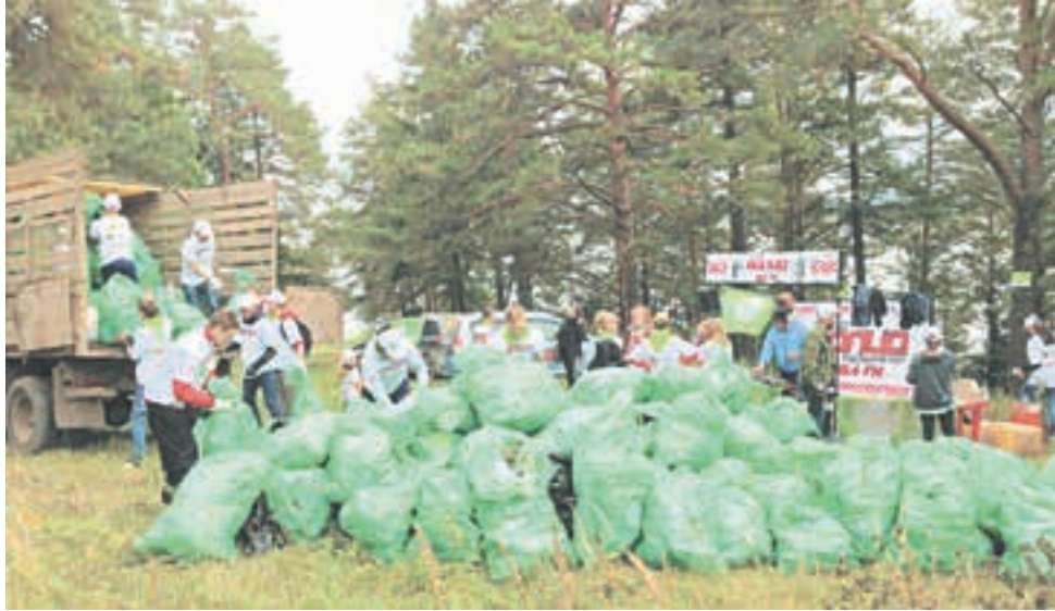
В Кудымкаре участники акции «Сделаем!» вывезли полный грузовик мусора

Сами участники мероприятия говорят, что готовы и дальше участвовать в подобных субботниках, чтобы как можно больше людей обра-