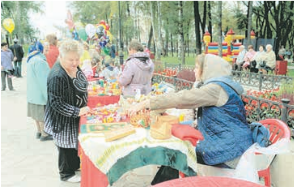
75-летие Мотовилихинского района жители города отпраздновали в Райском саду