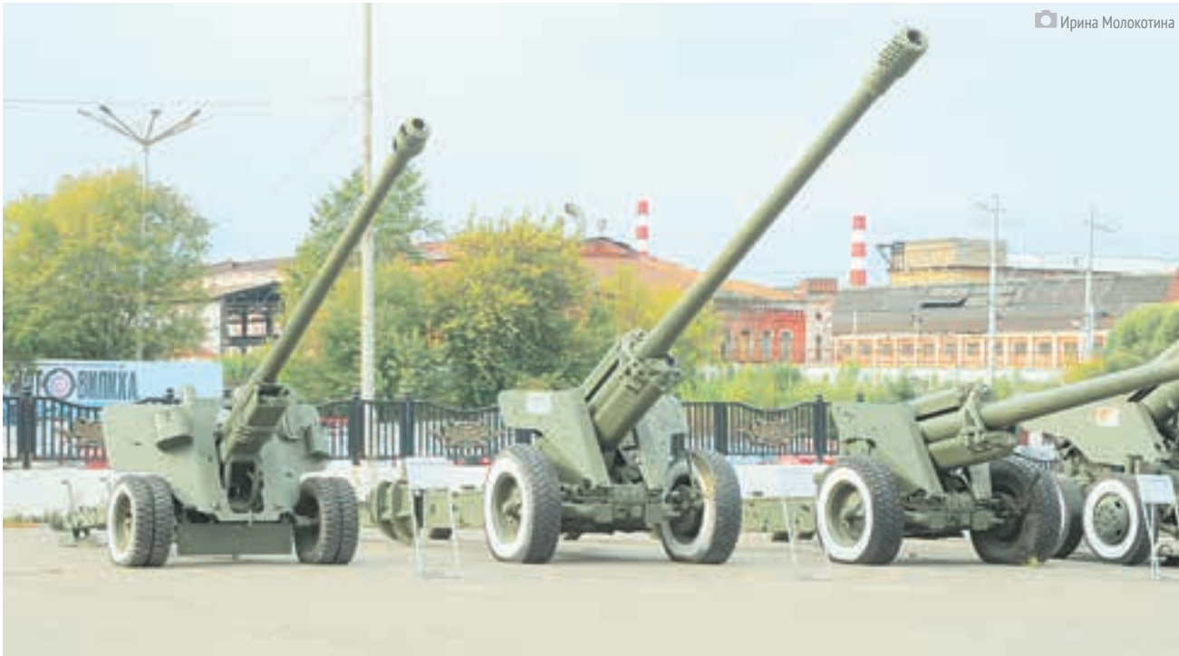
Музей ОАО «Мотовилихинские заводы», предприятия с историей почти в 300 лет