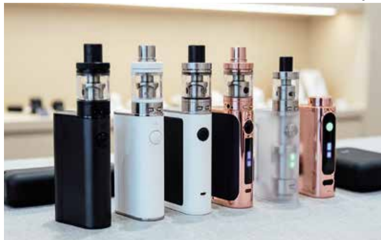
ФОТО СГЕНЕРИРОВАНО НЕЙРОСЕТЬЮ QWEN

Публичные консультации по законопроекту прошли с 26 марта по 10 апреля. В ходе обсуждений поступили замечания от бизнес-ассоциаций, таких как Ассоциация компаний розничной торговли (АКОРТ), Ассоциация малоформатной торговли (АМТ) и «Опора России». Они выразили опасения, что законопроект может вступить в противоречие с федеральным законодательством и привести к переходу рынка в нелегальный сектор. Однако разработчики законопроекта не согласились с этими замечаниями. По утверждению властей, за нелегальную торговлю предусмотрены административные наказания. КС