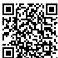
«Бизнес длиною в жизнь» (№5 за 24 марта 2026 г.)