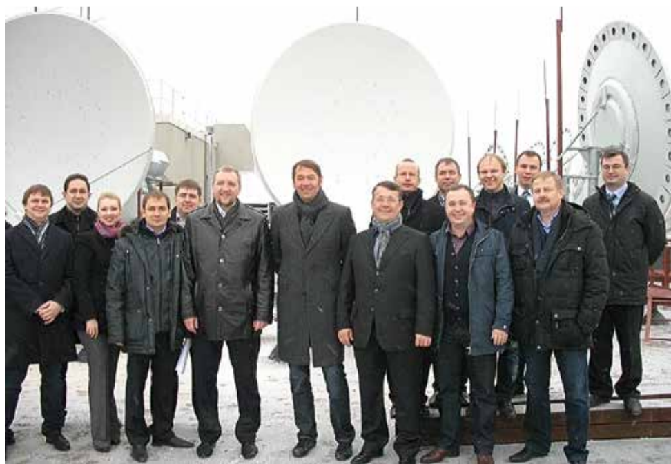
Старт «ЭР-Телекома» в Санкт-Петербурге, 2010 год

На старте такое поведение было супер, когда мы, как пираты, захватывали города России — их рынки телекоммуникаций. Наверное, по-другому было нельзя, но, когда пришло время спросить: где деньги, где чистая прибыль, где свободный денежный поток, где дивиденды? — ответа не было. Почему от нас клиенты уходят, почему отток персонала 30% каждый год? Много было вызовов в нашей компании, и некоторые мы не решили до сих пор.