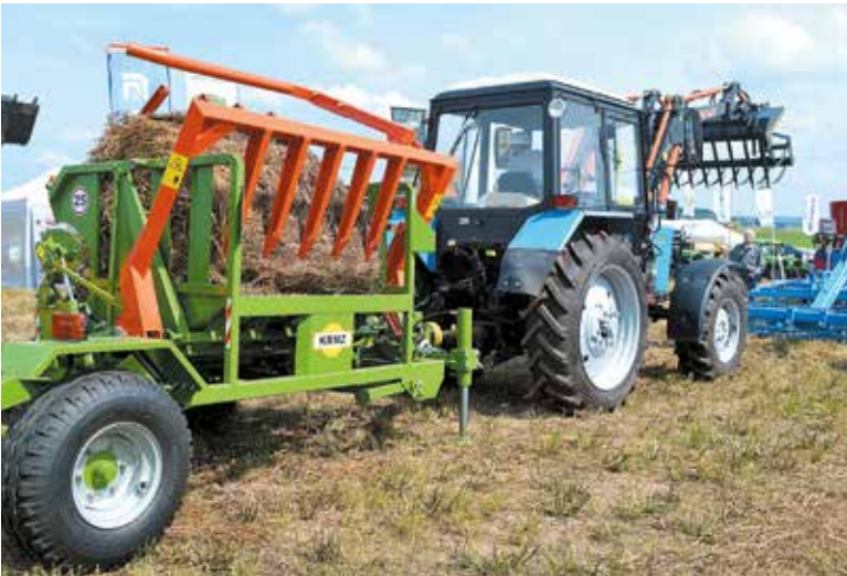
Резчик ИРК-01.1 из линейки KRMZ Innovation

Компания налаживает партнёрство с агровузами и инновационными предпринимателями