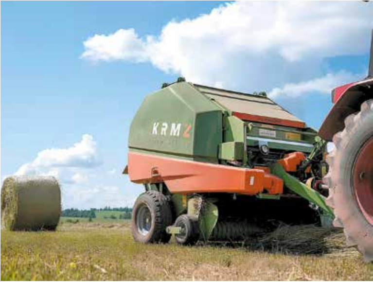
Пресс-подборщик R12 Super из линейки KRMZ Innovation

Краснокамский ремонтно-механический завод Пермский край, Краснокамск 617060, ул. Трубная, 4 Тел. +7 (342) 255-40-51 www.senazh.online E-mail: agro@krmz.info