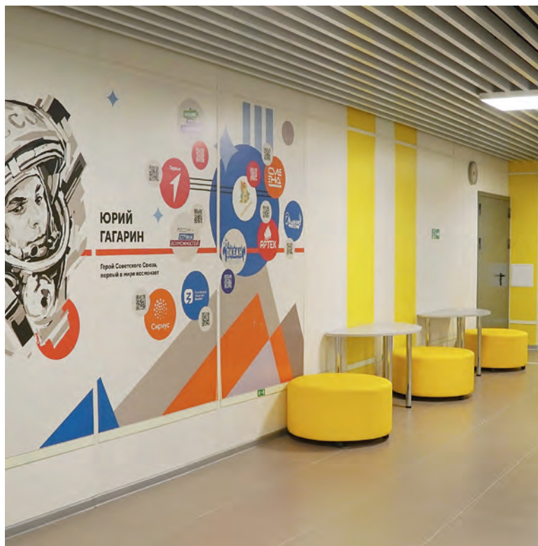
ФОТО ПРЕСС-СЛУЖБА ПЕРМСКОЙ ГОРОДСКОЙ ДУМЫ

По словам начальника департамента образования администрации Перми, в приоритете городских властей сегодня не только строитель-