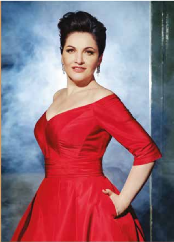
Народная артистка России Хибла Герзмава