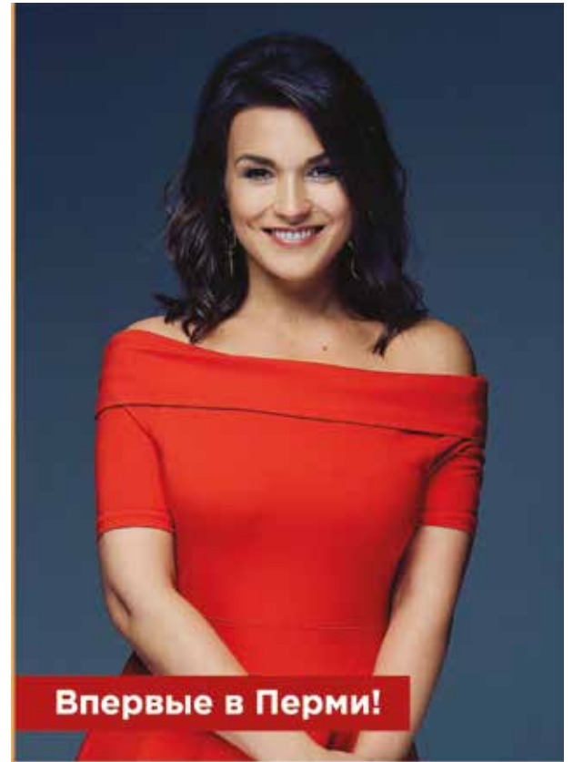
Заслуженная артистка России Аида Гарифуллина