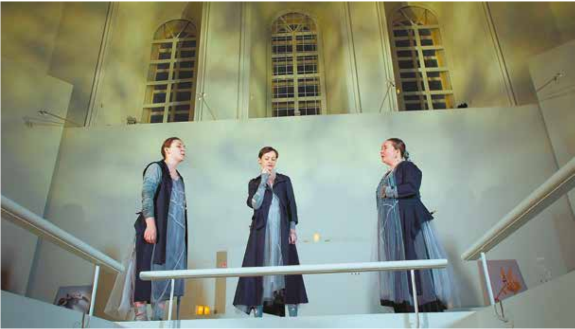
Кадр из фильма «Проводы»

В студенческий конкурс вошло 11 картин. В этом году многие студенческие фильмы объединяет лейтмотив пути. Вместе со своими героями авторы преодолевают расстояния, попадают в отдалённые и труднодоступные пространства: географические, топографические