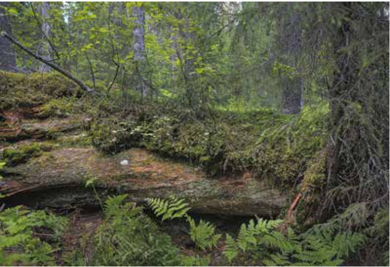
Кадр из фильма открытия «Флаэртианы» «Древний лес. Хранитель жизни»

На закрытии фестиваля 25 сентября в киноцентре «Кристалл» будет показан фильм, который получит главную награду международного конкурса. КФ