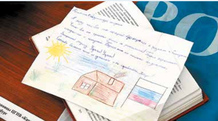
Открытка для бойца ВС РФ. Он хранил её при себе на протяжении боевых действий