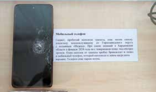
Мобильный телефон, пробитый осколком гранаты, сброшенной дроном на бойца Фёдора Ендураева