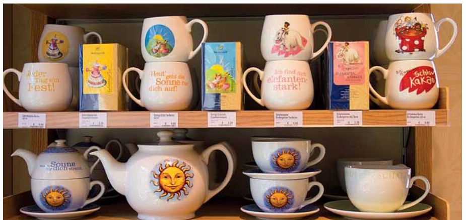
Магазин в городе Цветтле. Население — около 11 000 человек. Годовой оборот магазина за 2012 год составил €280 тыс.

им хорошую значимую работу и долгосрочные перспективы. Они счастливы вернуться, потому что выросли в наших краях, многие из них родились тут, на этих маленьких фермах.