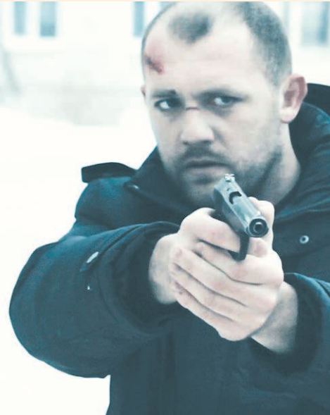
В кинотеатрах Перми с 8 августа

В день долгожданных родов своей жены майор полиции Сергей Соболев мчится в роддом вне себя от счастья. На скользкой зимней дороге он насмерть сбивает шестилетнего мальчика на глазах у несчастной матери. Превышение скорости, неосторожность и пешеходный переход — доказательства очевидны, как и нежелание молодого отца угодить за решётку. Майор использует своё служебное положение, чтобы оправдать себя... Сам того не желая, он запускает целую череду смертей, остановить которую решится слишком поздно.