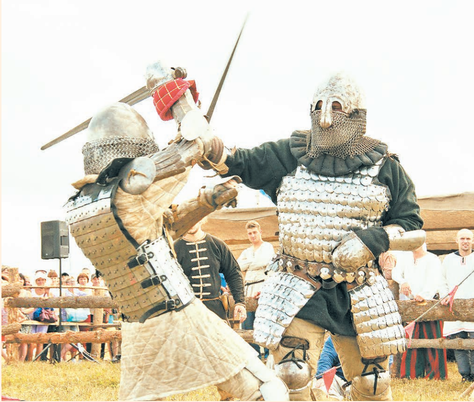
Чердынский район, село Камгорт, 9–11 августа

Любители активного отдыха смогут отправиться в приключение по Камгортским тропам, таящим много неизвестного и удивительного, поучаствовать в экологическом конкурсе биваков, сразиться на мечах и пострелять из лука.