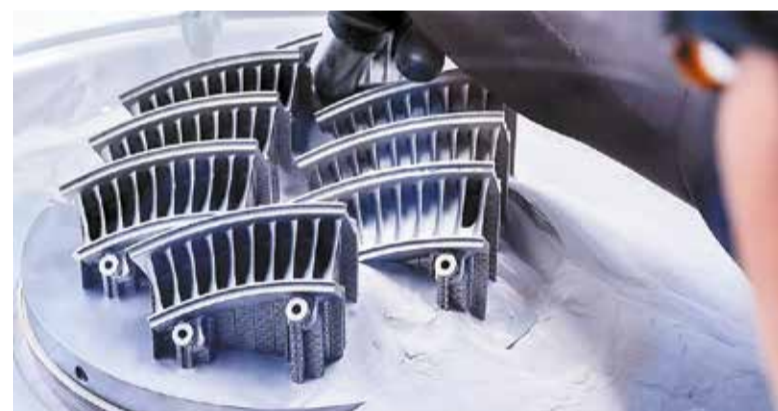
3D-печать лопаток авиационного двигателя

“ Основная идея заключается в предоставлении доступа к современному оборудованию и экспертным знаниям в области аддитивного производства