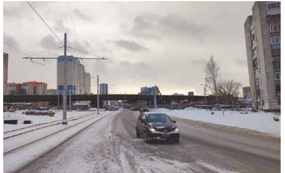
Путепровод на пересечении шоссе Космонавтов с улицами Столбовой и Крисанова

Здесь же в этом году начнётся строительство бассейна на ул. Уинской, 70а с двумя плавательными чашами. Он будет возводиться на сред-