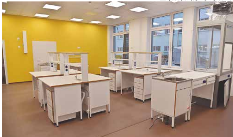
Оснащение кабинета химии в новом корпусе гимназии №33

Современные учебные корпуса возведены в разных районах города: Дзержинском, Мотовилихинском и Свердловском. Школа на ул. Кронштадтской, 41 откроется в первом квартале этого года. В новом здании