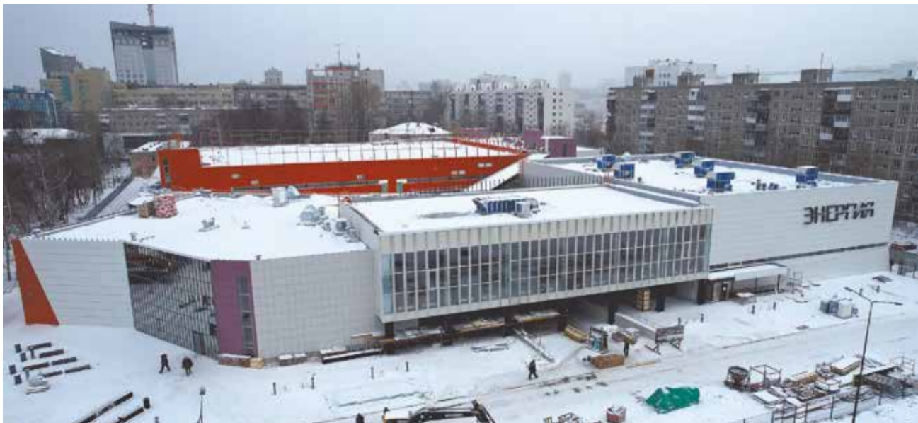
Универсальный спортивный комплекс «Энергия»

План по капитальному и текущему ремонту дорог и дворов Перми в 2024 году власти города пока не