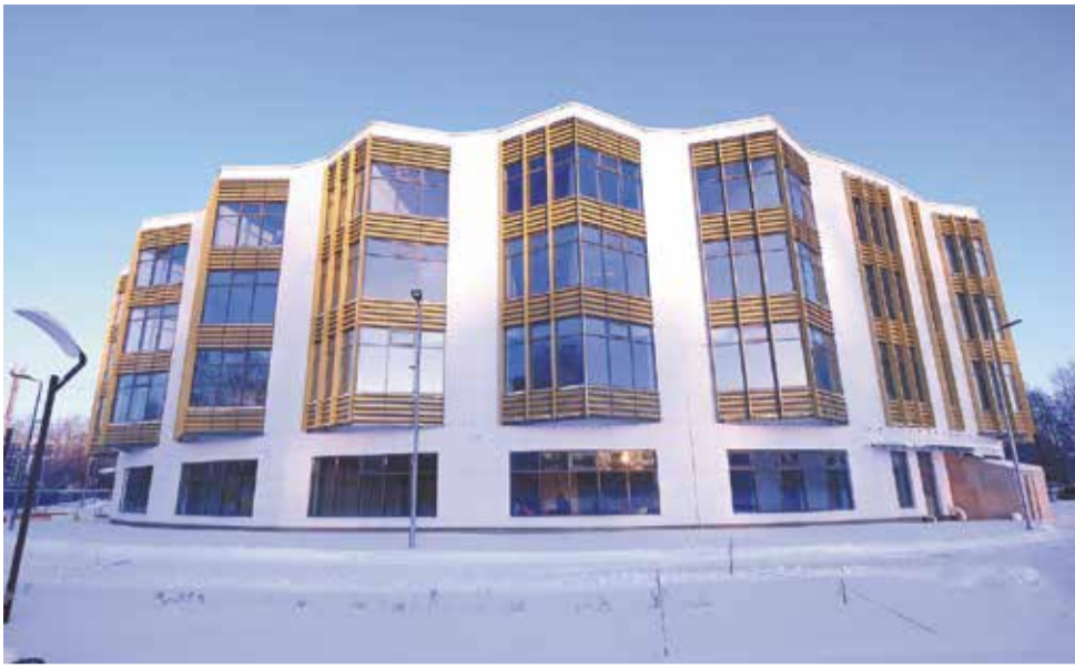
Здание Краевой музыкальной школы