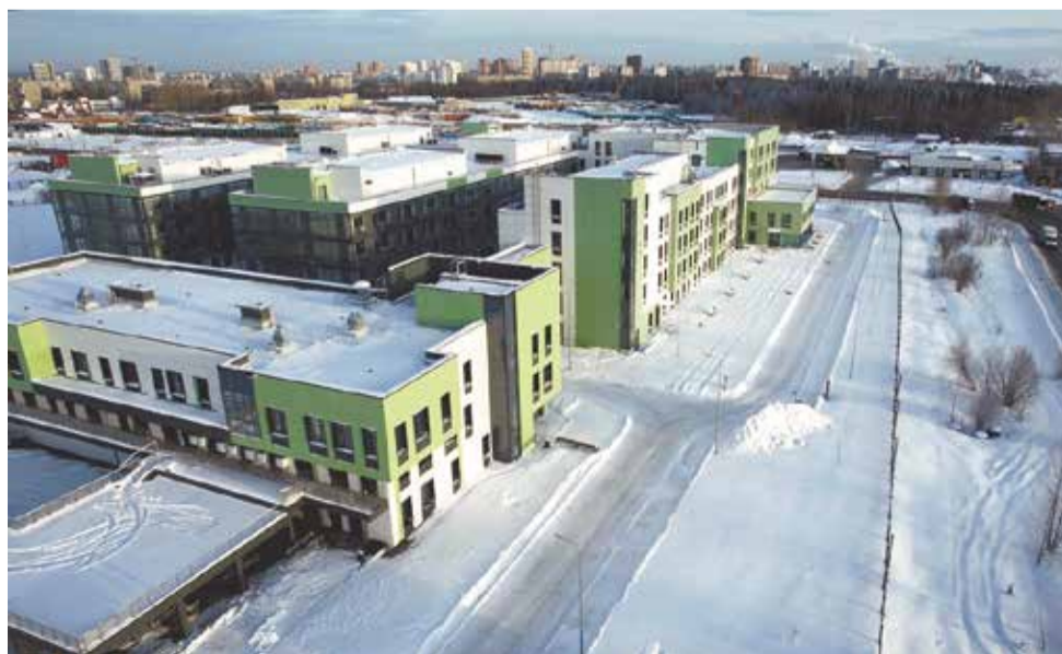
Комплекс зданий новой краевой инфекционной больницы

Значимыми событиями этого года станут завершение строительства нового корпуса авиационного техникума им. Швецова и окончание реконструкции здания политехнического колледжа им. Славянова . Оба объекта сейчас на финальной стадии строитель-