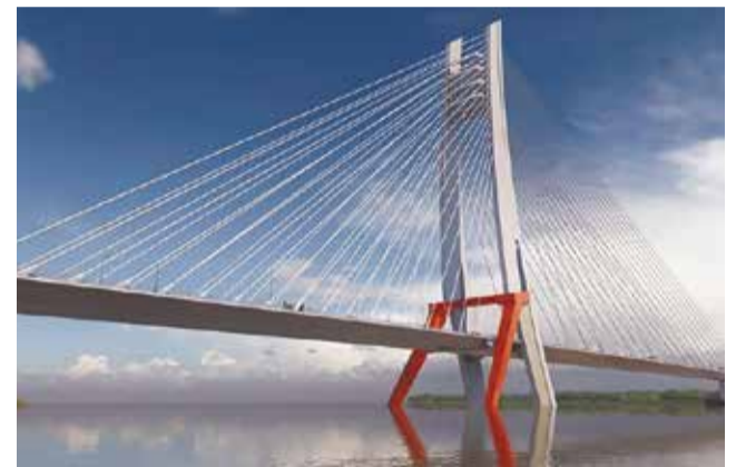
Проект третьего моста через Каму

В планах городских властей на этот год — обустройство двух спортивных площадок в Свердловском и Кировском районах. Помимо этого, в Перми появится ас-