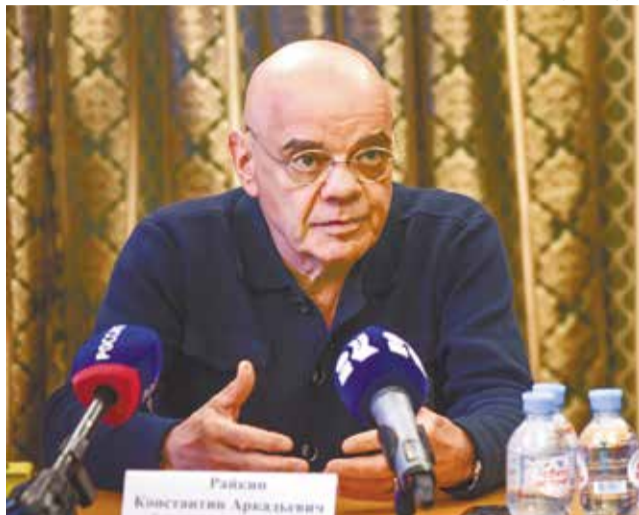
Администрация города Перми

Пермские зрители уже побывали на гастролях Государственного академического театра имени Евгения Вахтангова, увидели постановки Санкт-Петербургского государственного академического театра «Балет Бориса Эйфмана», оценили громкие творения Московского театра «У Никитских ворот» под руководством Марка Розовского