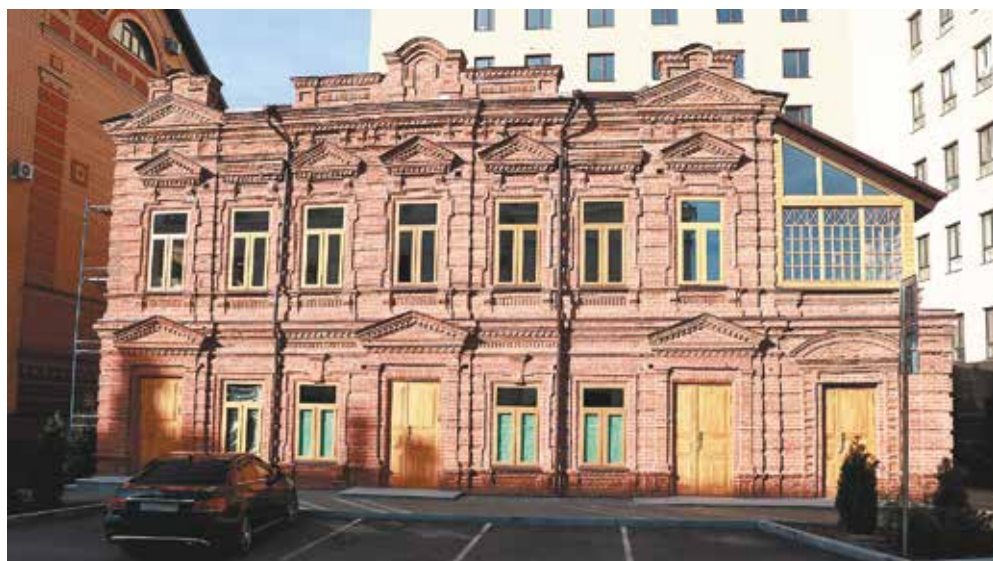
После реставрации. 2023 год

В этом году в Перми был полностью отреставрирован старинный особняк на ул. Советской, 32. На это обратили внимание многие читатели «Пятницы». Они же и обратились в редакцию с просьбой рассказать о том, кто привёл в порядок здание, которое после восстановления стало украшением квартала.