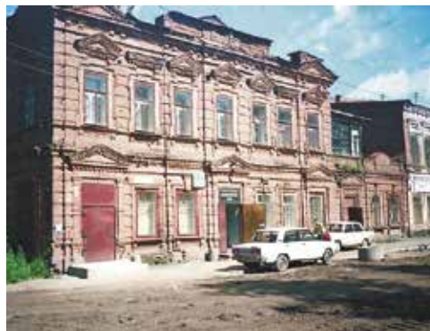
До реставрации. 1980-е годы...