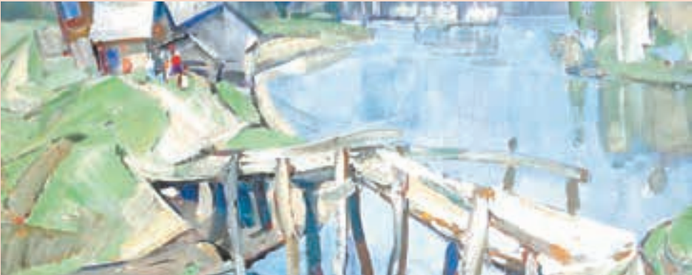
Александр Репин, «Мостик», 1973

Галерея «Марис-арт» представляет многожанровую художественную выставку на «речную» тематику.