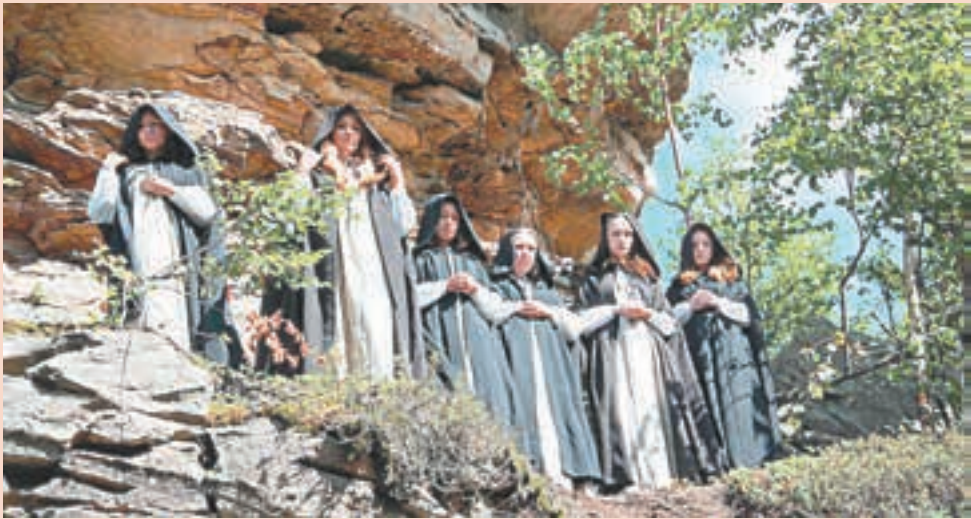
Гремячинский район, Каменный город, 6, 7, 13 и 14 июля, 14.00 и 18.00. Все подробности и возможность приобрести билеты online — на сайте фестиваля «Тайны горы Крестовой» www.krestovaya.ru

Всего под открытым небом состоится восемь спектаклей, каждый из которых смогут посетить не более 60 зрителей. Организаторы при этом отмечают, что на время представления в Каменный город будут допускать только зрителей с билетами, чтобы максимально обеспечить безопасность участников действия на природном ландшафте.