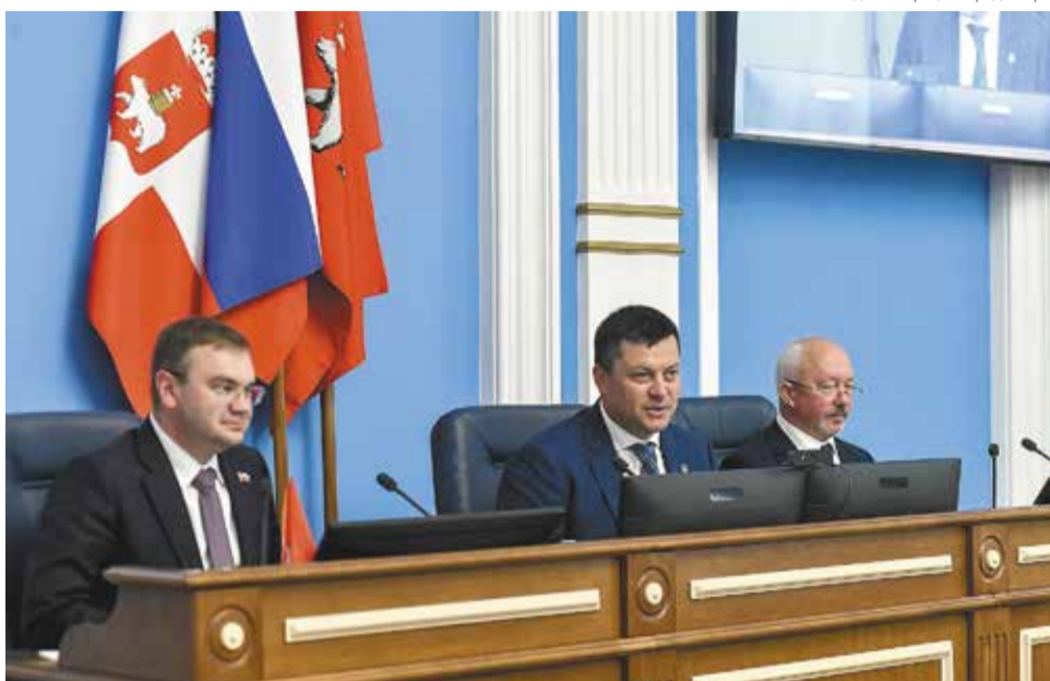
Администрация города Перми

В завершение мероприятия участники собрания избрали руководящие органы управления — председателя и его заместителей, исполнительного директора и членов ревизионной комиссии. Новым руководителем Ассо-