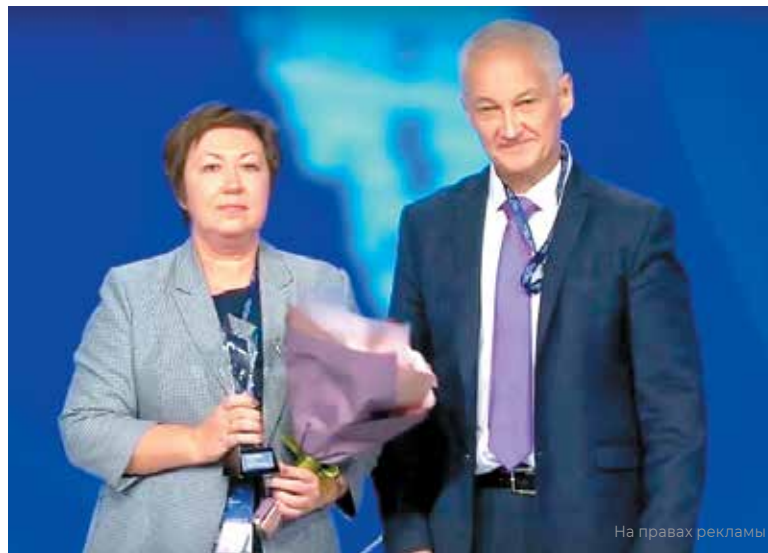
Церемония награждения «Экспортёр года»

Приоритетами развития компании неизменно являются улучшение качества выпускаемых видов продукции в соответствии с требованиями рынка, расширение продуктовой линейки предприятия — освоение выпуска новых видов целлюлозно-бу-