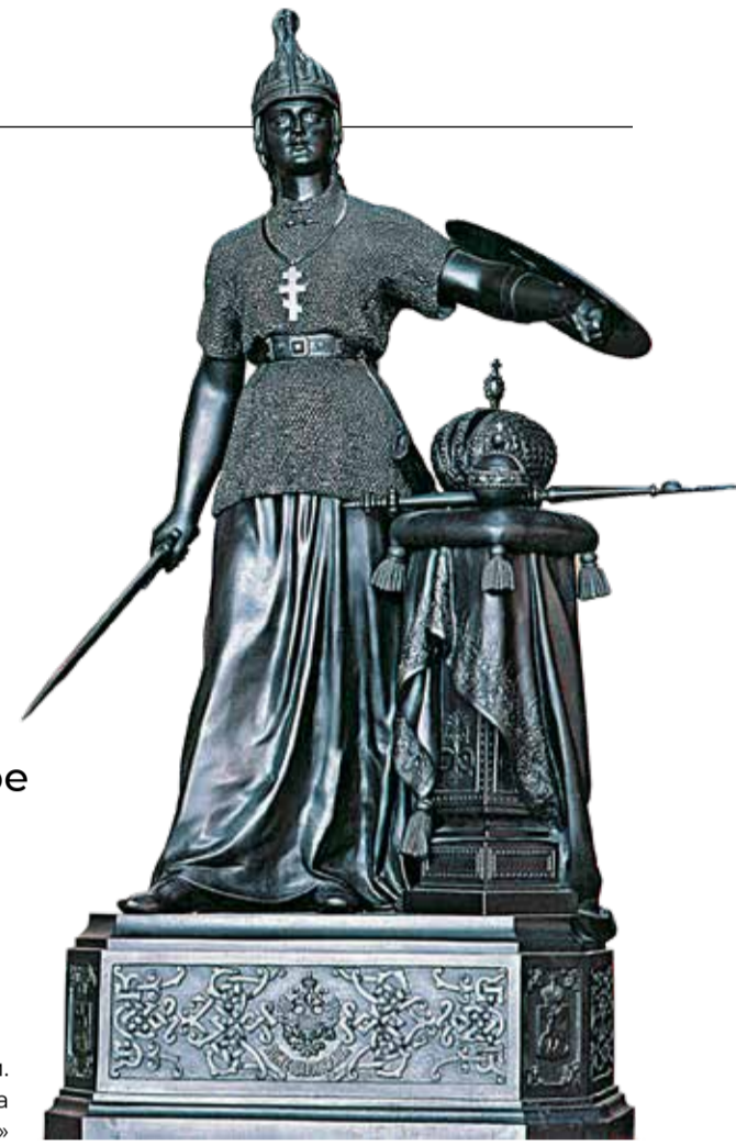
Н. А. Лаверецкий. Скульптура «Россия»