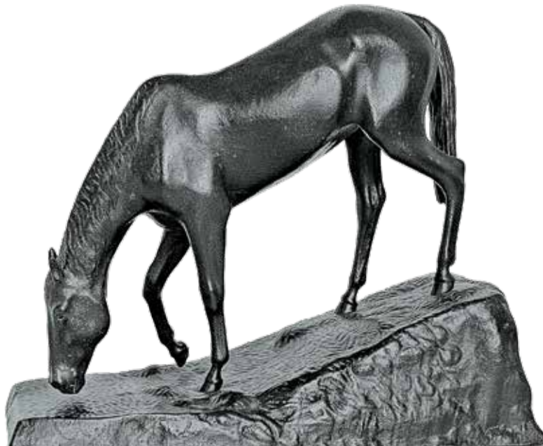
П. К. Клодт — А. Дунаев. Скульптура «Лошадь-кобылица на водопое»

Экспозицию открывает раздел, где представлены произведения древнерусского искусства —