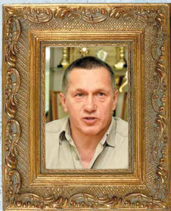
Юрий Трутнев, глава города (декабрь 1996 — декабрь 2000)