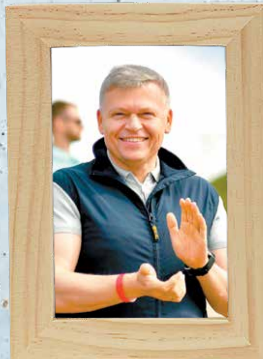
Алексей Дёмкин, глава города Перми — глава администрации Перми (декабрь 2020 — июнь 2023)