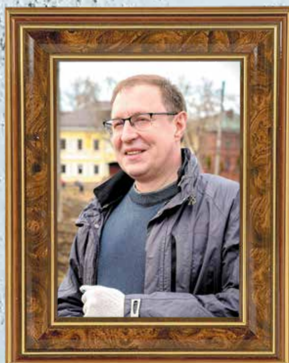
Дмитрий Самойлов, глава Перми — глава администрации Перми (ноябрь 2016 — декабрь 2020)