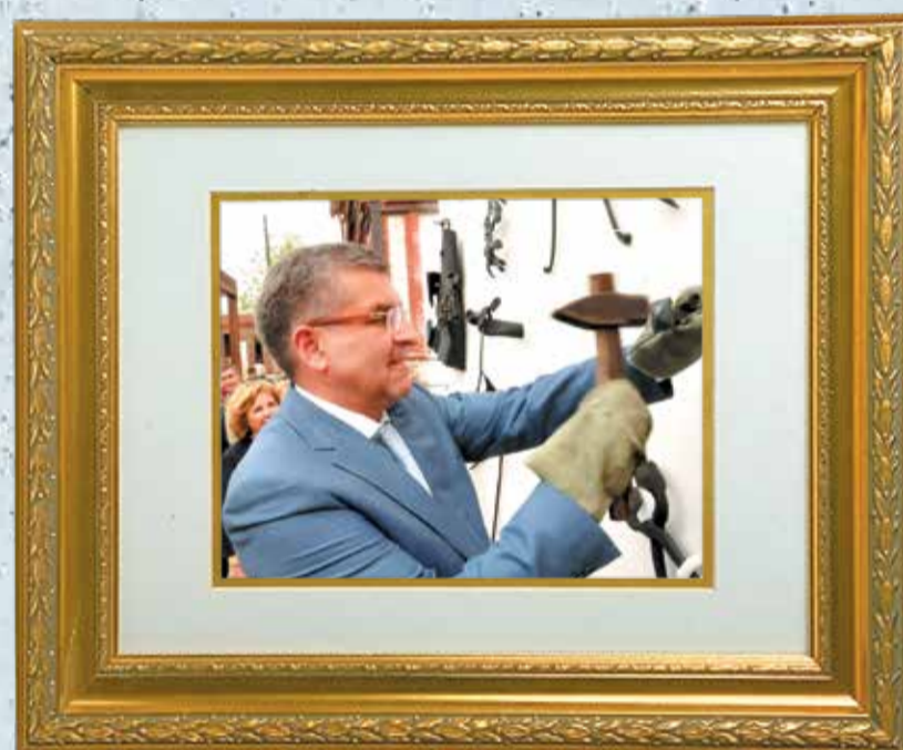
Игорь Сапко, глава города — председатель Пермской городской думы (декабрь 2010 — сентябрь 2016)