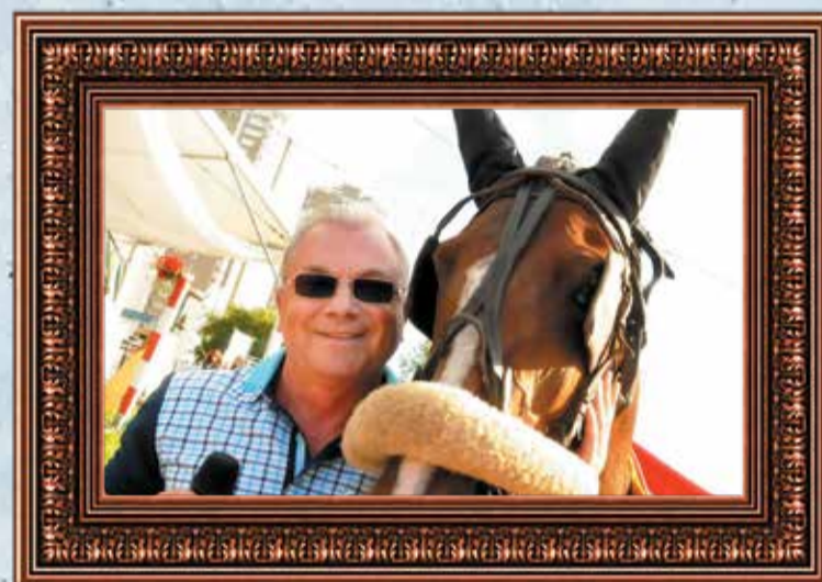
Аркадий Каменев, глава города (декабрь 2000 — ноябрь 2005)