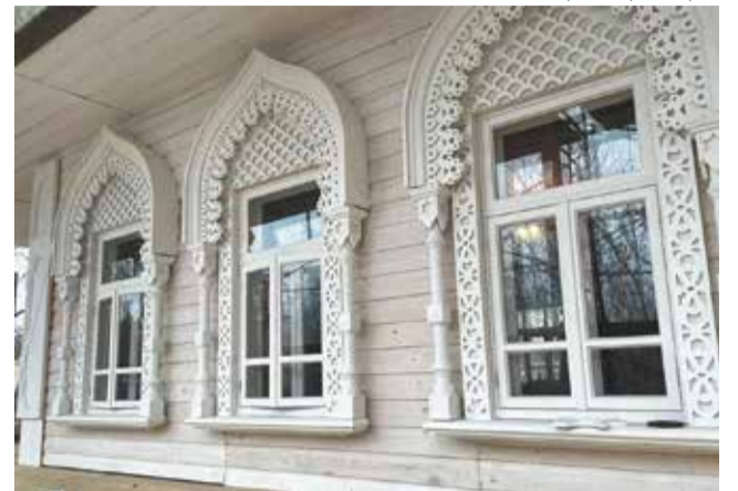
Администрация города Перми

Судьба другого сохранившегося здания деревянного зодчества будет решена