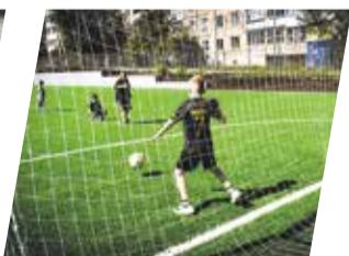
Администрация города Перми

На ул. Инженерной, 5 открылась новая спортивная зона. У Школы бизнеса и предпринимательства обустроено футбольное поле, волейбольная и баскетбольная площадки, а также сектор для прыжков в длину. Здесь также оборудована умная спортплощадка с тренажерами, турниками и доступом к онлайн-инструктору.