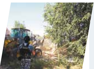
ГУФССП по Пермскому краю

В микрорайоне Чапаевском снесены 16 самовольно построенных домов. Ранее суд признал, что эти объекты появились незаконно, и возложил на их владельцев обязанность по демонтажу. Однако хозяева никаких действий по исполнению судебного решения не предприняли. В итоге снос выполнил подрядчик.