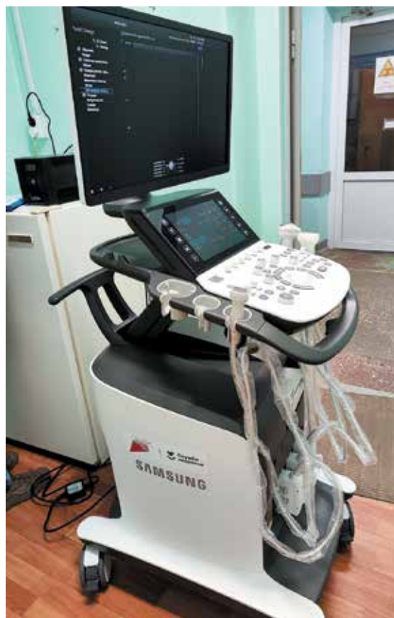
Аппарат УЗИ в Краснокамской городской больнице

В конце июня в первичное сосудистое отделение городской больницы Краснокамска было поставлено устройство Pablo стоимостью более 2,6 млн руб. Оборудование закуплено в рамках федерального проекта «Борьба с сердечно-сосудистыми заболеваниями» нацпроекта «Здравоохранение». С помощью этой аппаратуры прошли реабилитацию уже 15 пациентов.