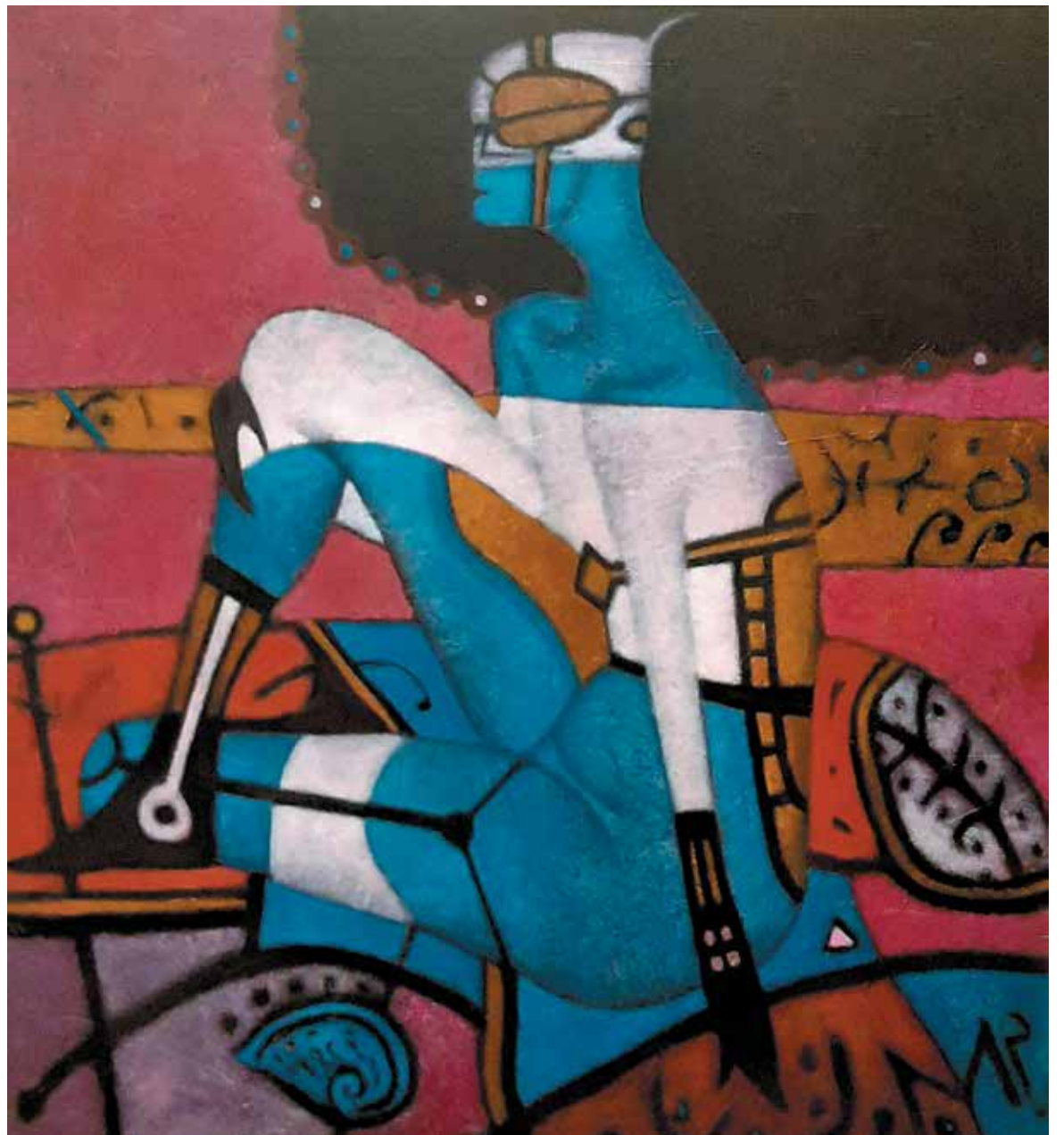
«На берегу». 2002