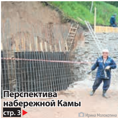
Перспектива набережной Камы стр. 3 ▶