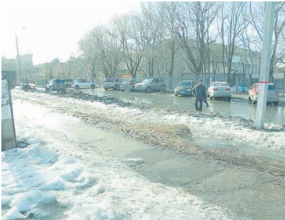
Тротуар на ул. Баумана до ремонта...

Продолжается и ремонт проезжих частей улиц. Идёт подготовка к дорожным работам на Коммунальном мосту через Каму, начался ремонт ул. Революции от ул. Островского до бульвара Гагарина.