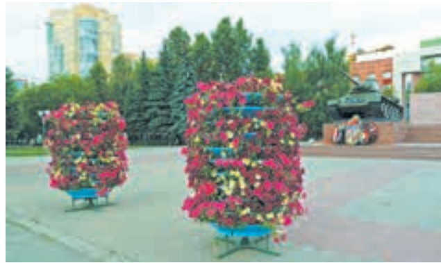
Цветники около мемориала Добровольческому танковому корпусу

Самый большой цветник Перми — на средней дамбе