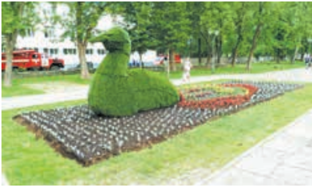
Цветник на улице Сибирской

В этом году пермяки могут полюбоваться цветником на площади Гайдара, газоном по ул. Карпинского, оформлением транспортной развязки на перекрёстке ул. Калинина