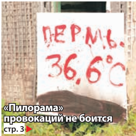
«Пилорама» провокаций не боится стр. 3 ▶