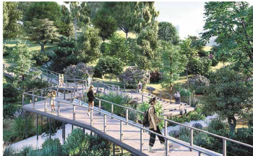
Проект развития долины реки Данилихи