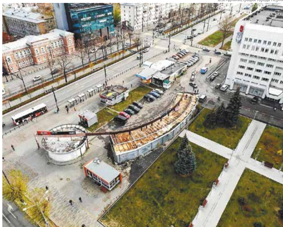
Администрация города Перми

К подлежащим сносу относились и объекты, расположенные на противоположной от ЦУМа стороне улицы. В отношении всех размещённых здесь торговых объектов и участков под ними было принято решение об изъятии для муниципальных нужд. Всем правообладателям были выплачены денежные компенсации.