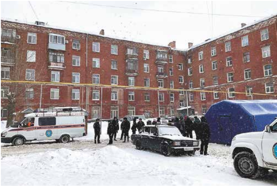
Пермская городская служба спасения

С 2 марта к охране здания приступила частная охранная компания. Это позволило организовать допуск жителей в свои квартиры, чтобы они могли забрать вещи первой необходимости. При поддержке районной администрации и волонтеров вещи некоторых собственников по их просьбе были вывезены на охраняемые склады или в места их временного проживания.