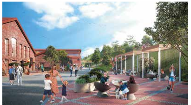
Променада на территории «Станции культуры»