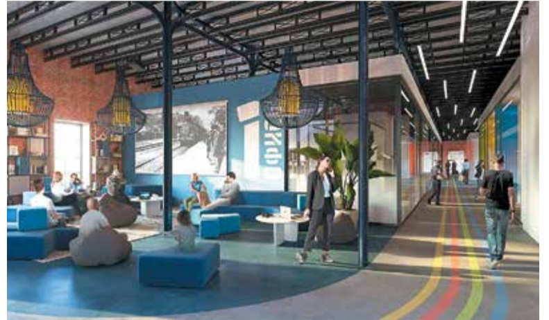
Коворкинг в офисной галерее

Реализация проекта начнётся в 2023 году. Он разделён на несколько пусковых комплексов, которые будут открываться поэтапно. Завершение проекта намечено на конец 2026 года. КС