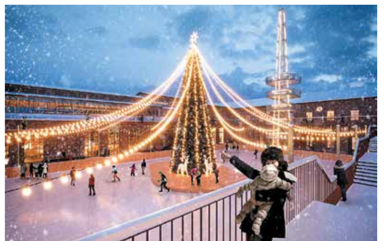
Каток в развлекательном дворике