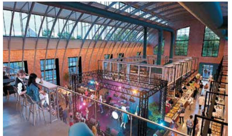
Фуд-молл в бывшем кузнечном цехе