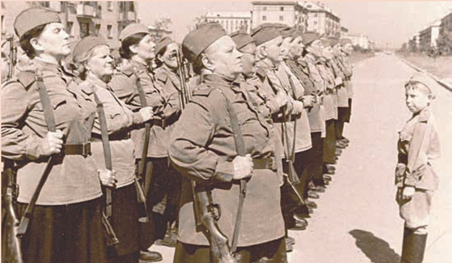
Кадры из фильма.

— Меня смущает римейк в чистом виде — любые повторы многое теряют. Моя мысль, хотя сотоварищи и не очень согласны: было бы интересно собрать участников того фильма, ведь все они, кроме Аделаиды, живы. И они станут дедушками и бабушками. А их внуки исполнят те же роли: Коляки, Пашки, Анюты. Это же их повторение!