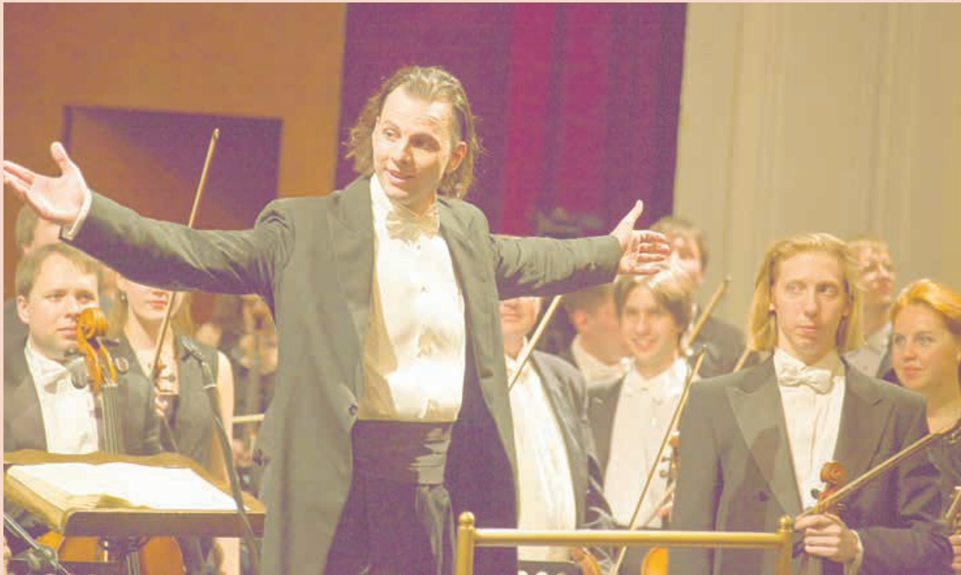
Большой фестивальный оркестр: главное «блюдо» фестиваля — персональный проект Теодора Курентзиса