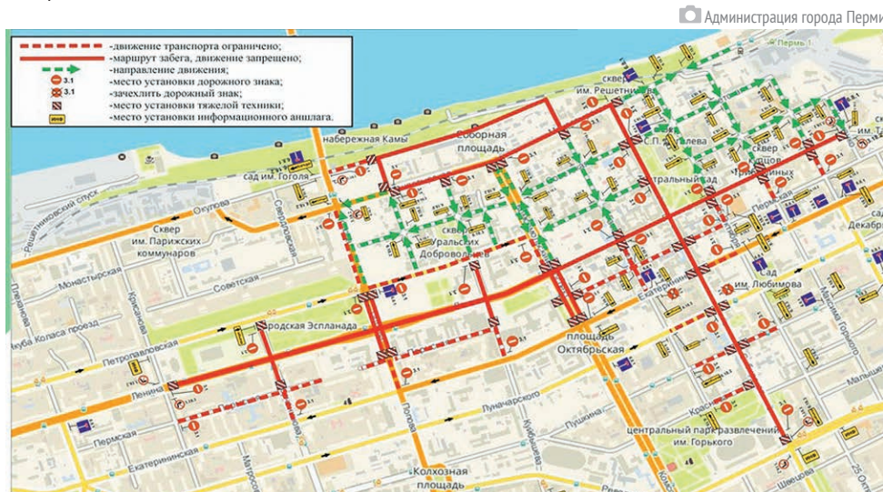
Схема организации дорожного движения на время проведения марафона 4 сентября