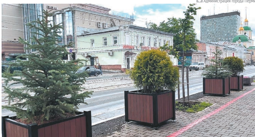
Администрация города Перми

На этой неделе стартовал эксперимент по мобильному озеленению — в центре Перми появились специальные передвижные ёмкости, в которые высажены хвойные деревца. Первые передвижные кадки с туями и елями установили на улицах Ленина и Сибирской. Об этом в своём Telegram-канале сообщил Глава Перми Алексей Дёмкин.