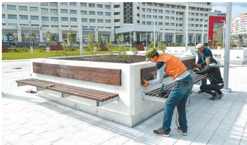
Администрация города Перми