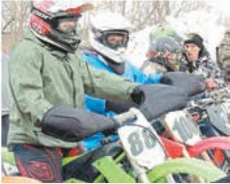
Спорт вне закона? стр. 15 ▶