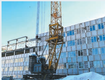
Реконструкция здания на ул. Целинной, 15

го комплекса «Спартак» на ул. Рабочей, 9 и городского Дворца молодёжи. Завершил свой выезд Глава Перми на стройке нового корпуса гимназии №17.