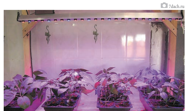
Оптимальное размещение фитоламп

Форму фитолампы подбирают в зависимости от количества посадок, размеров и формы ёмкостей с рассадой: круглые цокольные — для подсвечивания отдельно стоящих растений; линейные светильники — для контейнеров и длинных ящиков (их