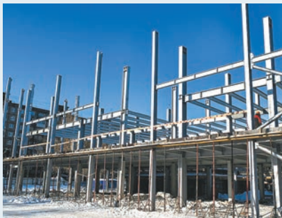
Строительство бассейна на ул. Гашкова, 20а