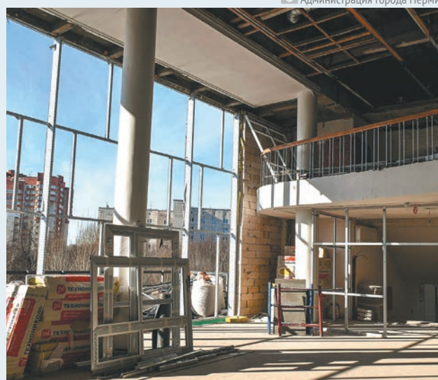
Реконструкция Дворца молодёжи