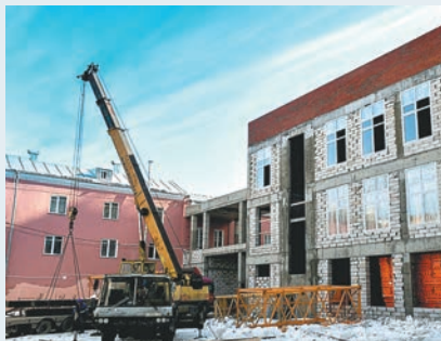
Новый корпус гимназии №17