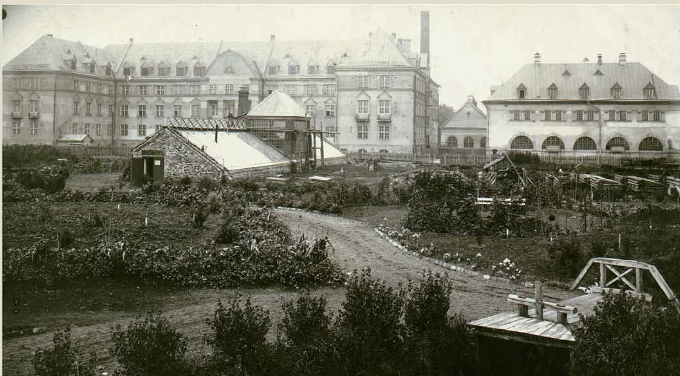
Пермский университет, конец 1920-х годов