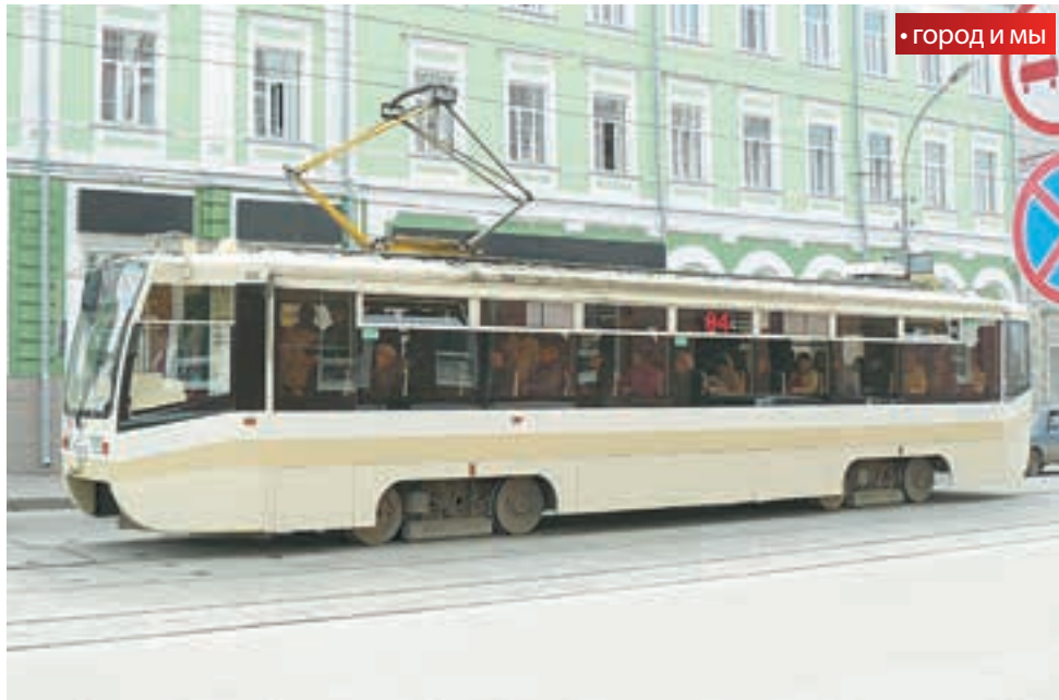
• город и мы