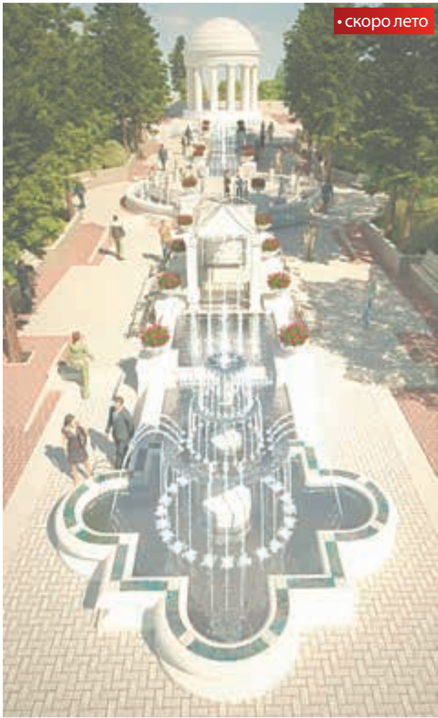
Так будут выглядеть Романовские фонтаны

музыку: днём люди будут слышать более динамичные мелодии, а вечером это будет приятный лаундж. Для пожилых людей будет звучать музыка 1930-40-х годов. Одной из главных новинок парка станут Романовские фонтаны. Открытие этого архитектурного комплекса приурочено к 290-летию юбилею Перми и 400-летию дома Романовых. По проекту молодого архитектора из Израиля Алексея Хамета, комплекс будет представлять собой пять автономных фонтанов, соединённых между собой и стилистически вписанных в пространство парка. Они протянутся от бокового входа на улице Краснова и до ротонды. Сейчас проект проходит согласование в краевом министерстве культуры. Фонтан будет выполнен из искусственного камня и украшен мозаикой. Стоит отметить, что осуществляться проект будет за счёт частных денежных вложений: в Перми объявлен сбор средств. Открытие фонтанного комплекса должно пройти с помпой. В Пермь уже приглашена Великая княгиня Мария — представительница династии Романовых. Кроме фонтана, в парке появятся новое кафе-мороженое, сады в стилистике разных стран мира и — самое