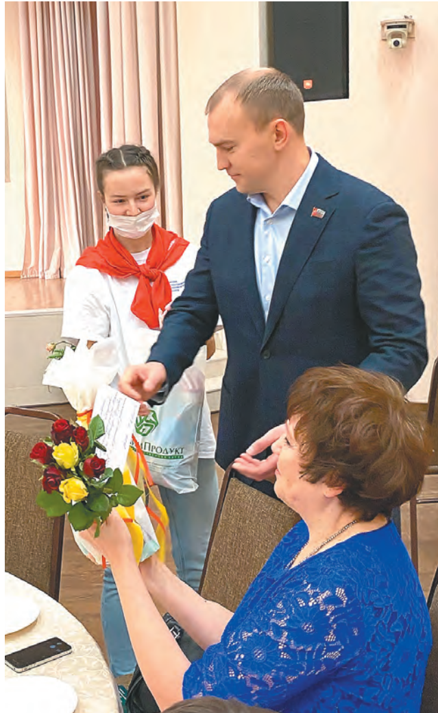
Предоставлено Николаем Булатовым