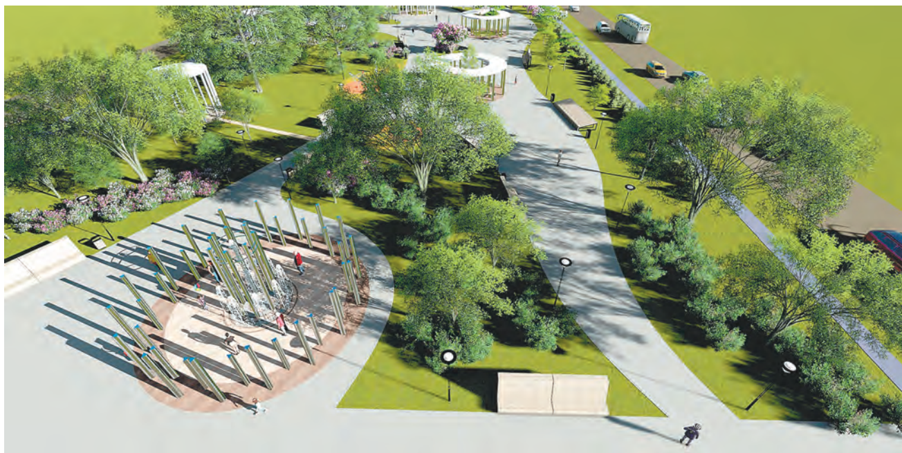
Проект сквера на ул. Макаренко

То есть я хочу выстроить такие отношения, чтобы на протяжении всего срока депутатских полномочий быть в постоянном контакте с жителями. И всю эту пятилетку работать так, чтобы люди это видели и могли сами оценивать деятельность своего депутата.