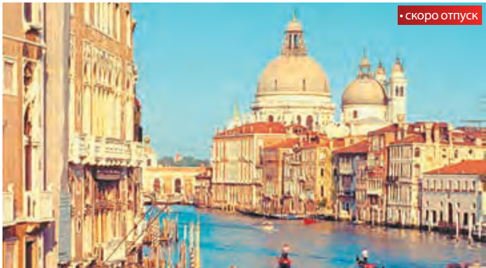
Европа — туристическое направление, сочетающее экскурсии и пляжный отдых

направление. Зимой это «экскурсионка» по историческим городам, её любят туристы в возрасте и студенты, выбирающие бюджетные туры. Вариант для более состоятельной публики — романтические уик-энды в Риме или шоппинг в Милане. Летом к этому добавляется и прекрасное пляжное направление, где можно совместить отдых на море с посещением Венеции, Флоренции, озера Гарда и Вероны. Каждый из этих туров принесёт массу впечатлений и положительный заряд на весь год. В целом зафиксирован рост популярности европейских направлений. Это направление отдыха ассоциируется с качеством, с возможностью ознакомиться с интереснейшими памятниками культуры, с изысканным шоппингом и замечательной гастрономией. Есть ли возможность отдохнуть за границей не очень дорого? — Выбирая тур, безусловно, каждый человек подсчитывает бюджет своего отдыха. Европейские туры всегда дороже, чем «пакетный» отпуск в Турции или Египте. Можно выбрать отель