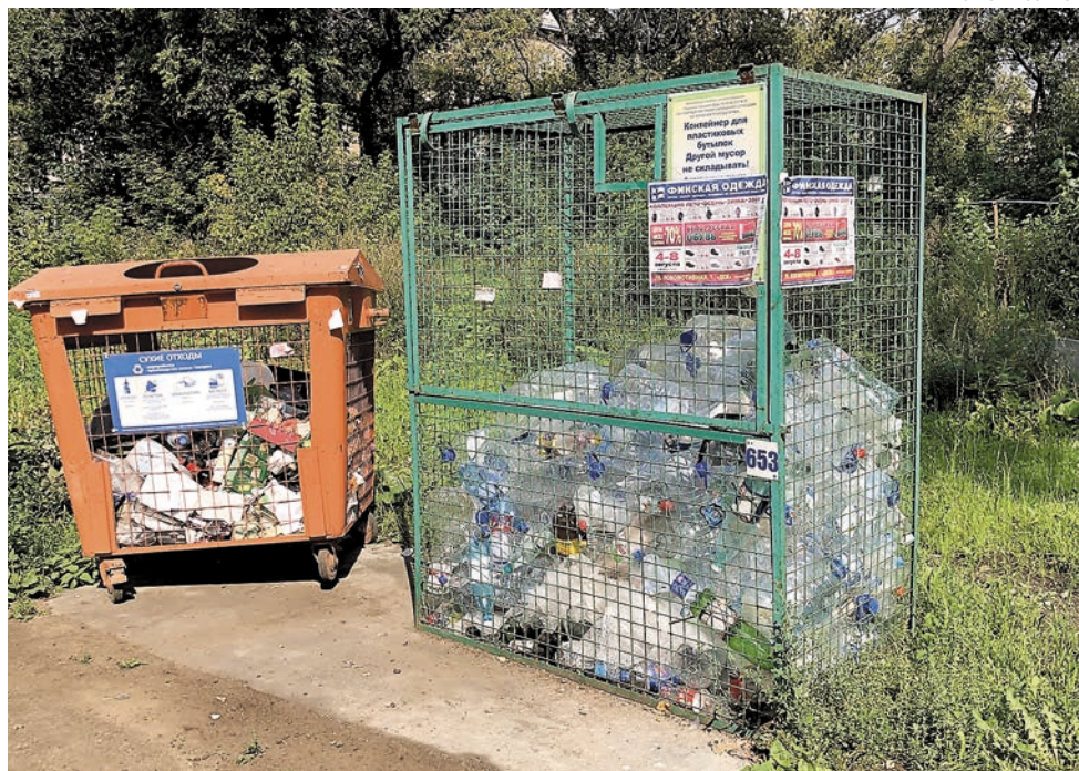
Пермяки для сбора сортированных отходов используют специализированные контейнеры

Комплекс по переработке мусора планируется построить на базе полигона «Софроны». Мощность станции по приёму отходов должна составить 300 тыс. т в год, площадки — 120 тыс. т в год. Здесь планируется сортировать бумагу, картон, стекло, разные виды пластика — всё, что пойдёт на вторичную переработку.