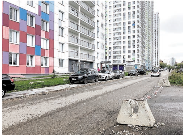
Ул. Василия Татищева