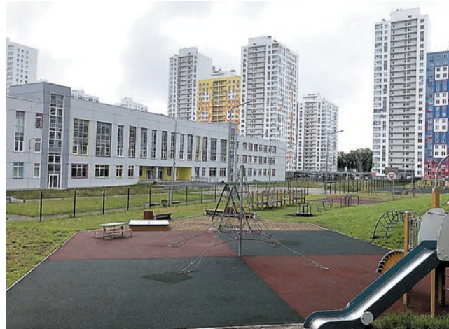
Школа в ЖК «Арсенал»