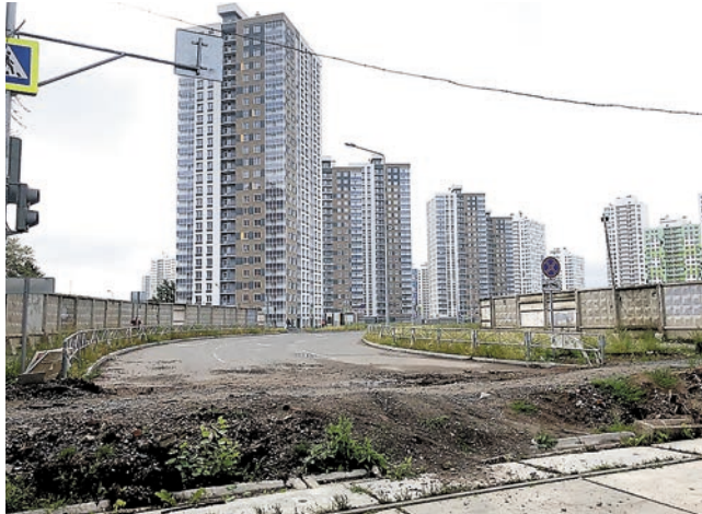
Выезд на ул. Карла Модераха

тир. Ещё один дом на 217 квартир сейчас получает разрешение на ввод в эксплуатацию. При этом застройщик оставил жителей «Арсенала» не только без школы и детского сада, но и без полноценной дорожной инфраструктуры. Проблемы с дорогами на территории комплекса имеются как сезонные, так и круглогодичные. К примеру, этой зимой застройщик отказался содержать дороги и очищать их от снега. Круглогодично на въезде и выезде из ЖК образуются заторы.