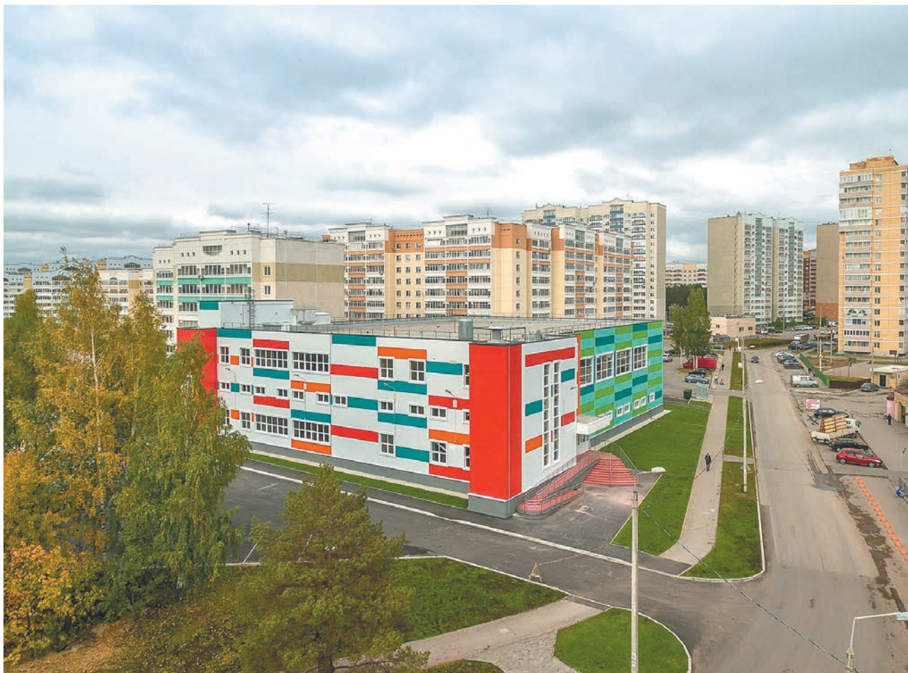
Спортивный комплекс «Рекорд» с бассейном