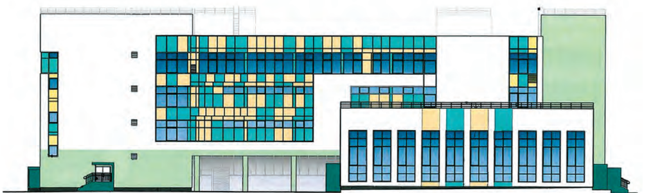
Проект новой школы на ул. Холмогорской