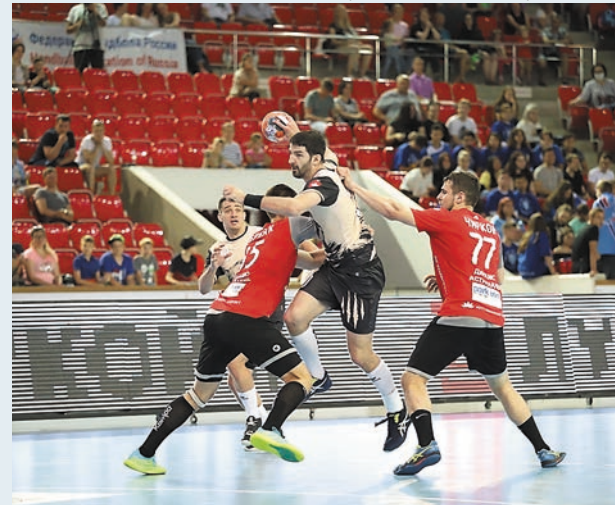
ГК «Пермские медведи», vk.com/permedvedi

Чемпионом России в 20-й раз стала подмосковная команда «Чеховские медведи», серебро — у столичного ЦСКА, бронза — у ставропольского «Виктора». Команда «СГАУ-Саратов» осталась на четвёртом месте. В розыгрыше сезона-2020/21 принимали участие 13 команд.