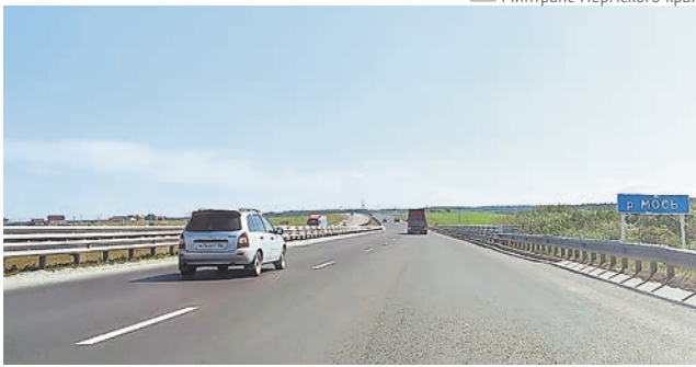
Минтранс Пермского края

В рамках нацпроекта отремонтируют ещё одну часть