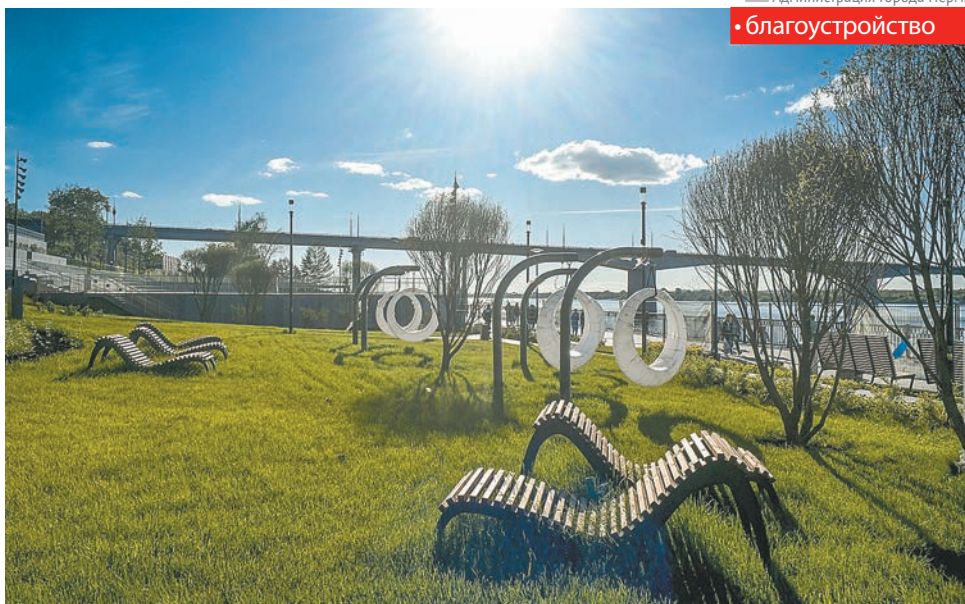
Администрация города Перми • благоустройство

В спортивной части набережной ведущая работы подрядная организация уста-