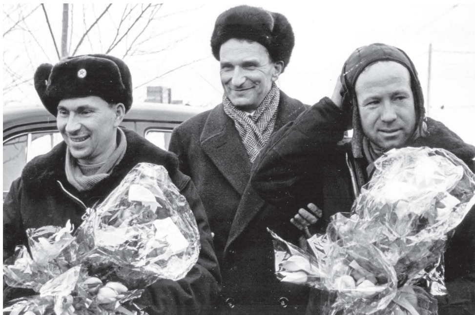
Космонавты Павел Беляев и Алексей Леонов. В центре — первый секретарь Пермского обкома КПСС того времени Константин Галаншин