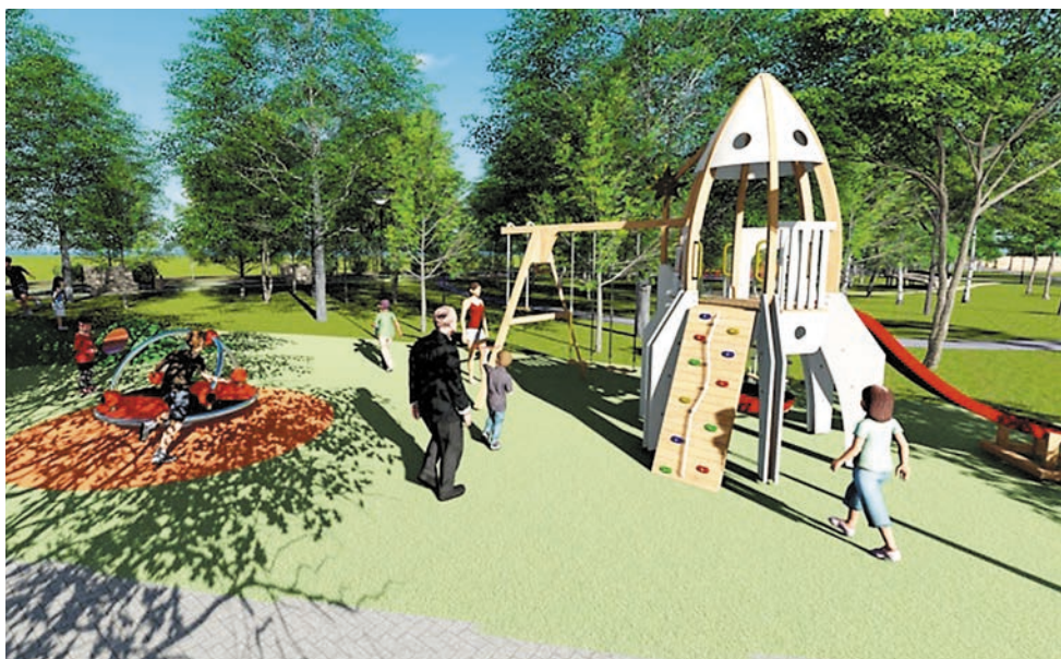
Проект сквера на ул. Макаренко

«Создание комфортной городской среды является одной из наших приоритетных задач. Благодаря федеральному проекту «Формирование комфортной городской среды» на территории Прикамья за четыре года обустроили 1658 дворов и 424 общественных пространства. В этом году мы планируем привести в порядок ещё 245 объектов. Хочу отметить и поблагодарить муниципалитеты, которые включились в проект. Жителей Пермского края призываю активно участвовать в голосовании. Именно ваше мнение определяет, какой из объектов предстоит реконструировать в первую очередь», — подчёркивает глава региона.