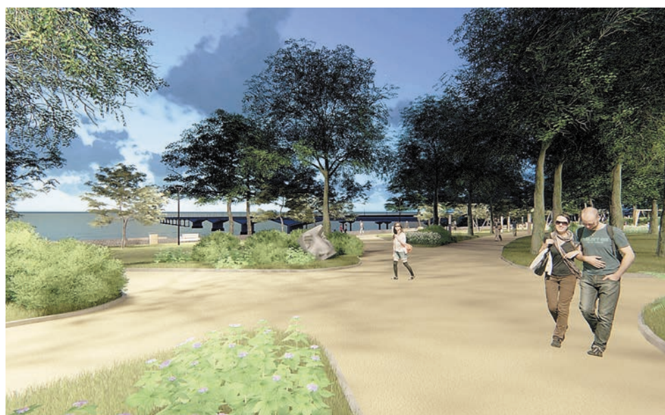
Проект благоустройства сада им. Гоголя