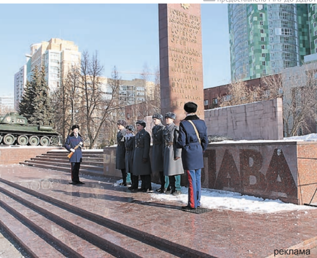
На посту №1 у Вечного огня славы

Незабываемо прошли вечера-портреты с почётными гражданами Перми. Ребята могли задать вопросы ветерану Великой Отечественной войны Герою Советского Союза Василию