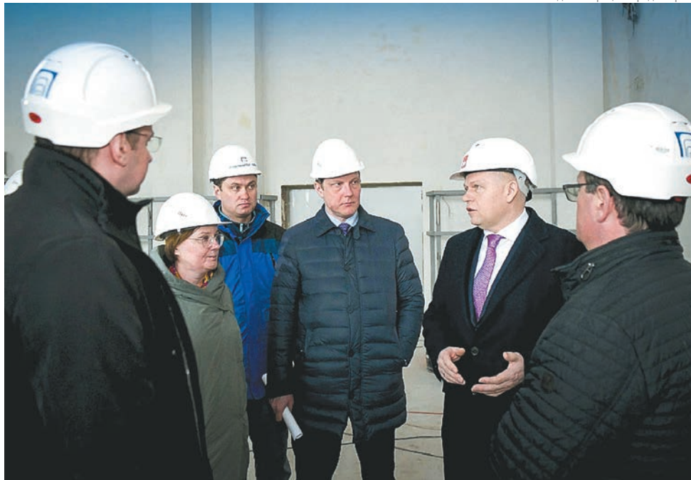
Администрация города Перми

Напомним, администрация Перми в последние годы системно занимается созданием социальной инфраструктуры образовательных учреждений. Начиная с 2015 года после открытия нового корпуса гимназии №11 им. Дягилева в городе ввели в эксплуатацию ещё три новых объекта: два корпуса-тысяч-