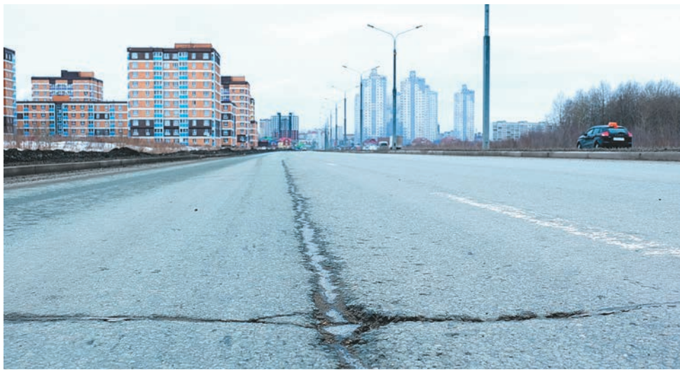
Выезд из Перми на Восточный обход в 2021 году приведут в нормативное состояние