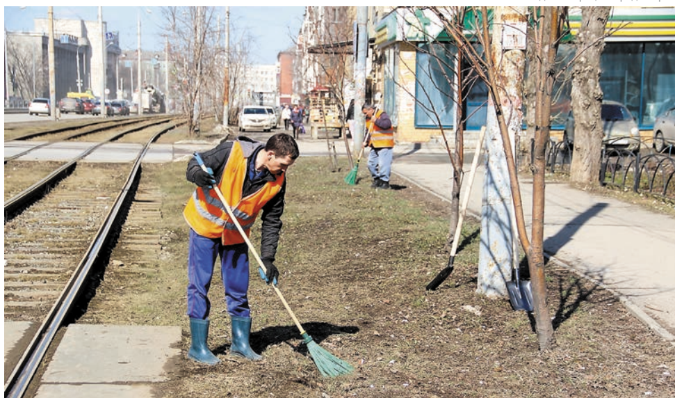
Администрация города Перми

В Ленинском районе городские благоустроители начали очищать от грязи дорожные ограждения с помощью машин, работающих по принципу бесконтактной мойки и с вертикальными щётками. Особое внимание уделяется мойке тротуаров, проезжей части и бордюров, уборке мусора. После проведения запланированных работ все улицы и остановки будут содержаться в текущем режиме. Подрядчик уже за-