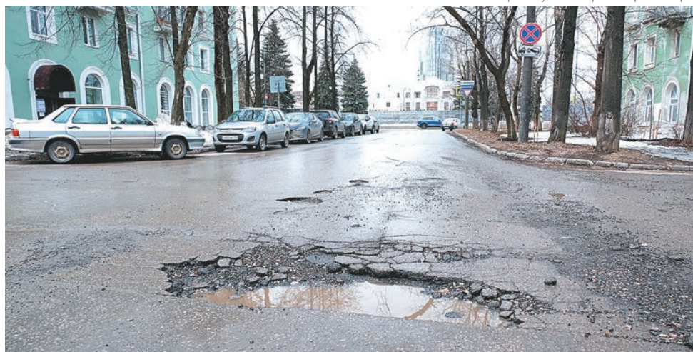
В 2021 году по нацпроекту отремонтируют ул. Павла Соловьёва в Перми

Ещё один федеральный проект — «Региональная и местная дорожная сеть». С 2022 года этот проект позволит регионам реконструировать аварийные и предаварийные мосты, а с 2023 года — строить путепроводы на региональных и местных дорогах.