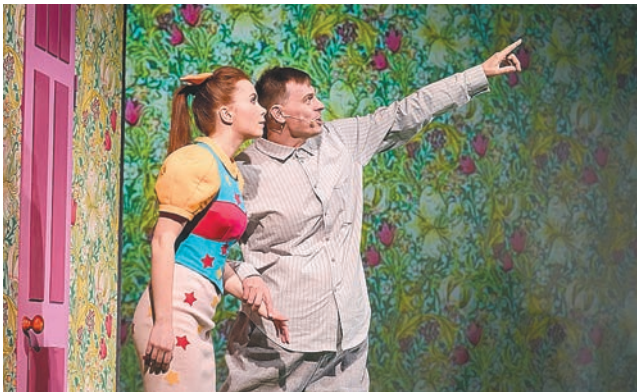
Пермский ТЮЗ, permtuz.ru

Выставочный центр «Пермская ярмарка», с 18 декабря