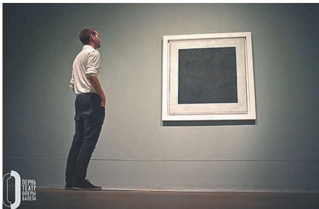
Пермский театр оперы и балета, permpopera.ru

Частная филармония «Триумф», с 12 по 16 декабря