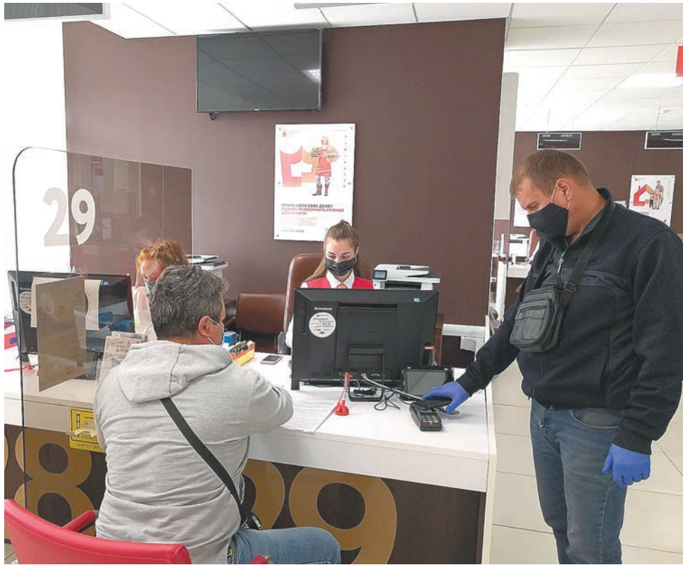
Пресс-служба МФЦ Пермского края

— В настоящее время отделения ГИБДД распо-