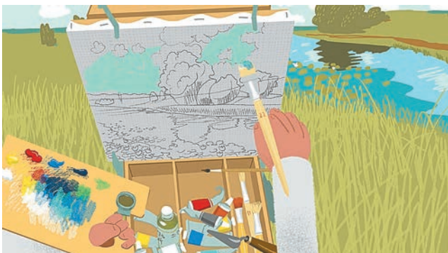
Пресс-служба Пермской художественной галереи

В Перми откроется интерактивная выставка-путешествие «Внутри картины» (0+), созданная специально для детей. Авторы проекта постараются интересно и с юмором рассказать детям и взрослым о том, что такое живопись. Посетители выставки смогут найти ответы на вопросы: что находится в мастерской художника, с помощью каких материалов и инструментов он создаёт картины, как и почему в разные эпохи развивалась и менялась живопись. Отдельный зал выставки будет посвящён предметной инсталляции «Внутри картины», которая позволит посетителям оказаться «по ту сторону» рамы и почувствовать себя героями живописного произведения.