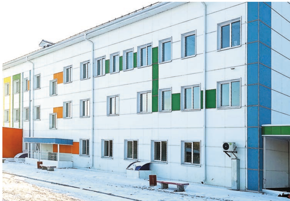
Новое здание на ул. Социалистической, 20 будет просторным и современным

В минувший понедельник, 7 декабря, в строящемся здании будущего лечебного учреждения со-