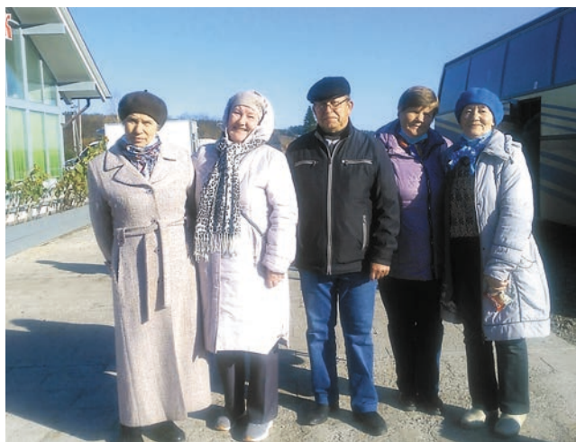
Экскурсия в Чусовой

По отзывам экскурсантов, организация поездок была на высоком уровне, а путешествия оставили только приятные впечатления и запомнятся надолго.