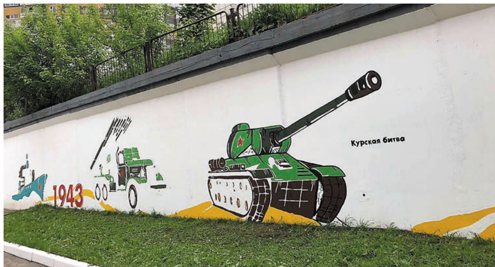
Художественное оформление подпорной стены возле лицея №9 — совместная инициатива родителей, администрации лицея и обучающихся к юбилею Победы

Руководство лицея не без основания надеется, что грядущие перемены оценят и ребята, и их родители.