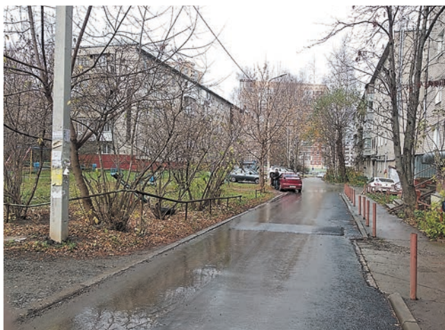
Ул. Пономарёва, 65

Депутат оказала помощь в приобретении радиомикрофонной системы и специального микрофона для проведения мероприятий в школе №135 с углублённым изучением предметов образовательной области «Технология». Теперь ребята и педагоги могут пользоваться современной и качественной техникой при проведении праздников, концертов и конференций.