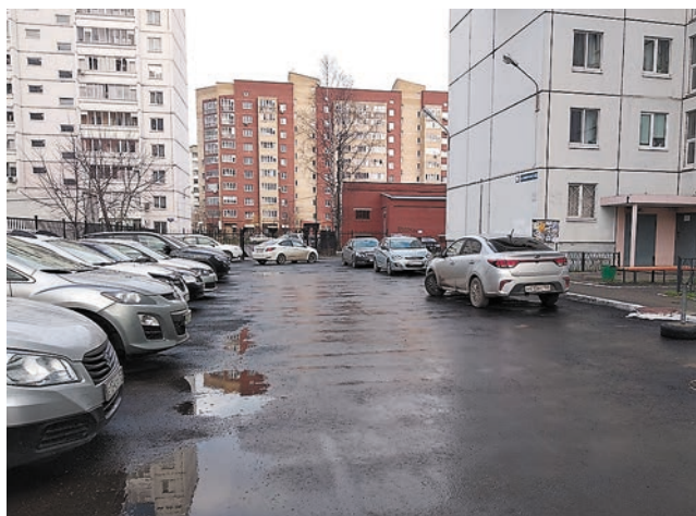
Ул. Пушкарская, 100