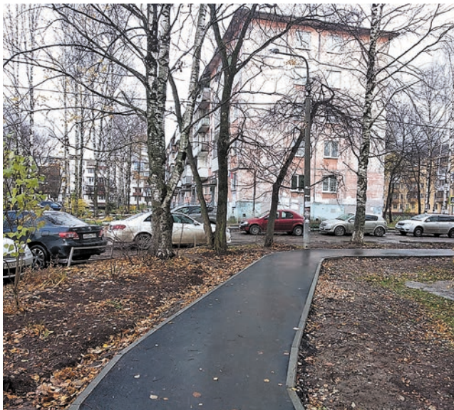
Ул. Крупской, 89

В рамках депутатских программ по просьбам жителей отремонтированы подходы к подъездам дома на ул. Крупской, 85, по нескольким адресам сделана обрезка деревьев (это ул. Крупской, 78а, ул. Пушкарская, 73, 75, 96, ул. Юрша, 7), отремонтирован проезд вдоль дома на ул. Пономарёва, 65, приведены в порядок тротуары у домов на ул. Уинской, 8 (между детской площадкой и хоккейной коробкой), на ул. Звонарёва, 4 и ул. Старцева, 35/3. Субсидии на ас-