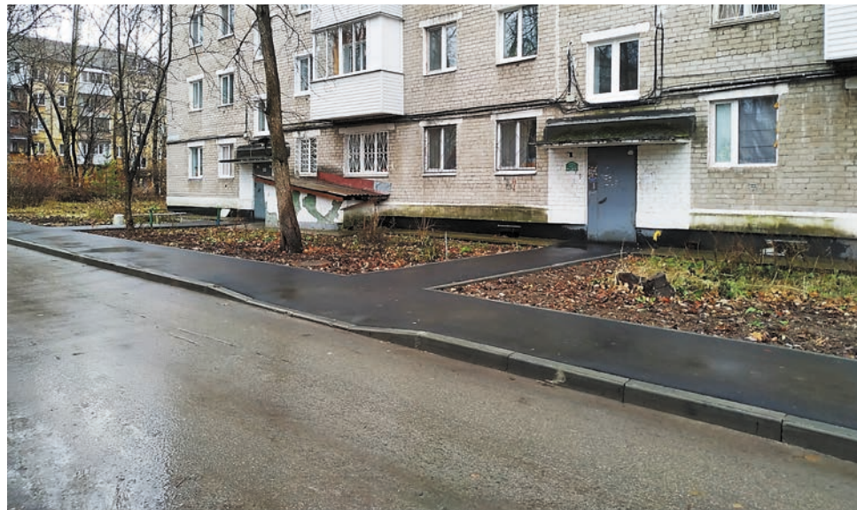
Бульвар Гагарина, 111/2

ЖК-16 дома на бульваре Гагарина, 111/2. — Когда-то, много лет назад, когда возвели наш и близстоящие дома, по сути, не были продуманы тротуары для пешеходов вдоль наших строений. Из подъезда мы выходили прямо на проезжую часть, благо тогда автомобилей было очень мало. Но со временем их число увеличилось в разы. Нам, жителям, стало небезопасно в собственном дворе, особенно рисковали дети. Наш депутат услышала нашу просьбу, внесла её в свой план, и посмотрите, какие замечательные дорожки у нас появились! Сейчас, совершенно не опасаясь машин, мы можем пройти от