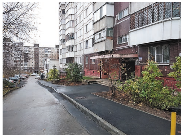
Ул. Звонарёва, 4