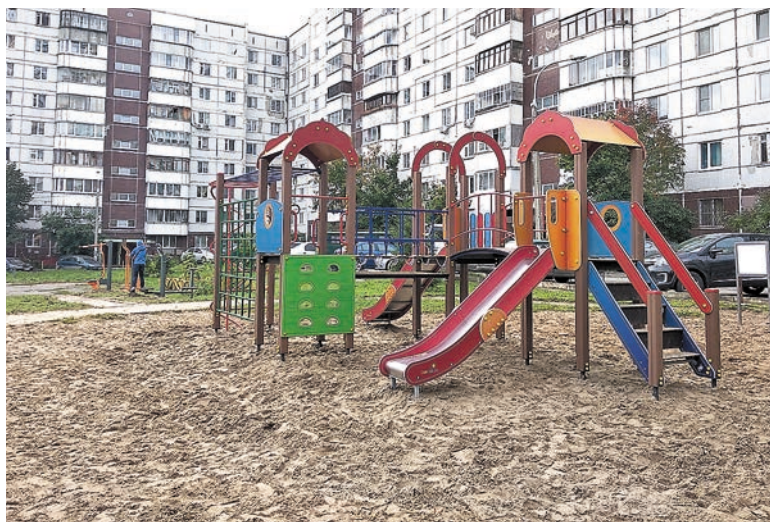
Детская площадка на ул. Лякишева, 9