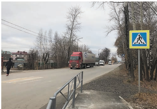
Въезд в Краснокамск