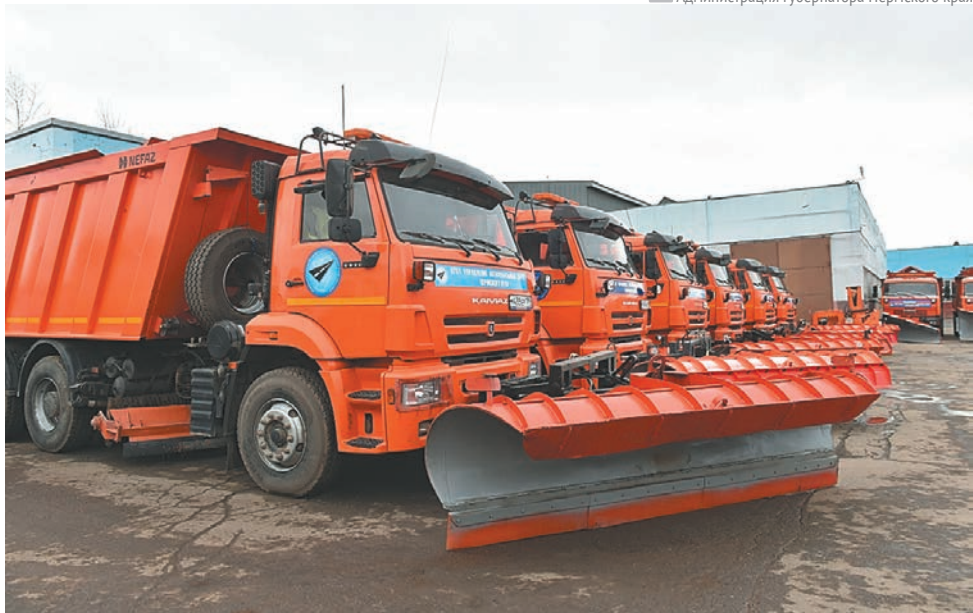
Готовность техники и заготовки противогололёдных материалов в крае составляет 100%