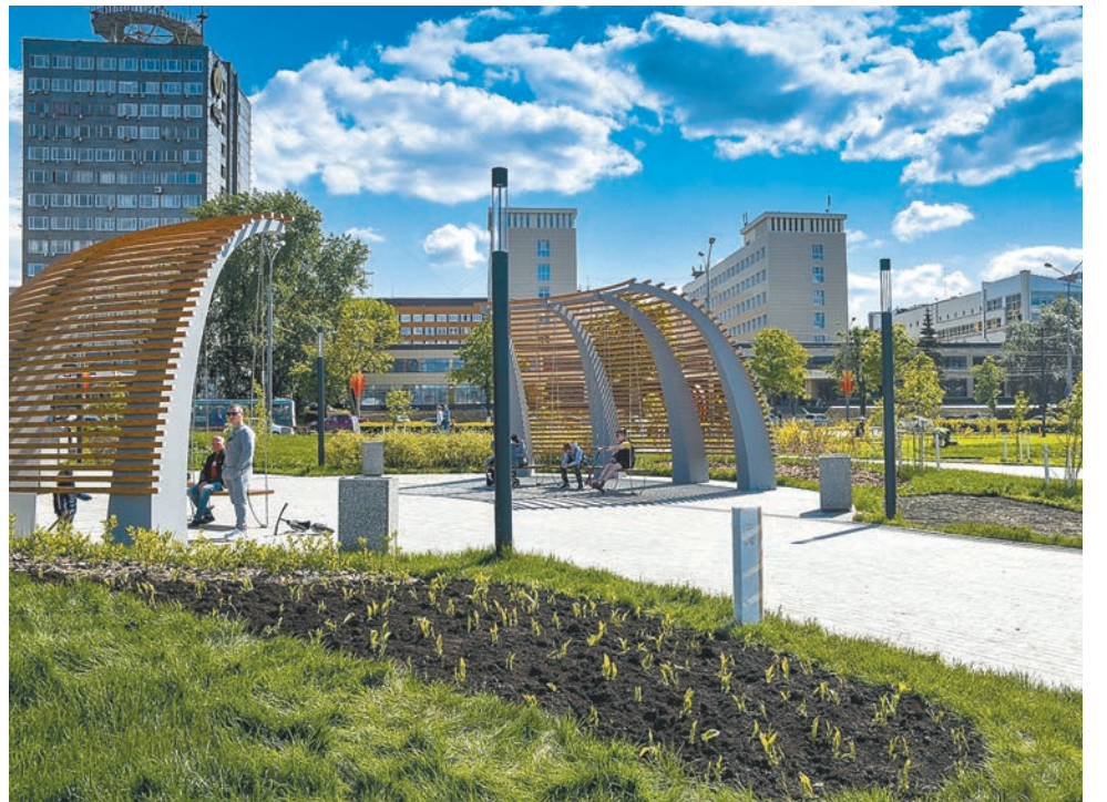
К юбилею города предстоит его масштабное преобразование

Что касается спортивных объектов, планируется строительство комплексов с плавательными бассейнами на улицах Гашкова, Гайвинской и Шпальной, а также завер-