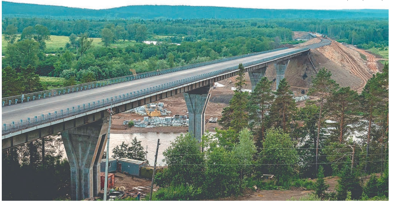
Обход города Чусового

На стадии строительства находится автодорога Кунгур — Соликамск с 292-го по 313-й км. Работы по первому этапу завершили ещё в 2019 году. В первой половине следующего года планируется приступить к разработке проектно-сметной документации второго этапа строительства трассы. Третий, четвёртый и пятый этапы выполняются по графику — ведутся строительные-монтажные работы. Проектирование шестого этапа реконструкции (ул. Мичурина) начнётся в третьем квартале 2021 года, проведение строительно-монтажных работ запланировано на 2021–