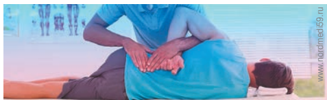
Клиника Норд Меди

Начнем с того, что заболевания суставов масса, и не нужно ставить себе диагнозы! Центр «Норд Меди» разработал комплексный индивидуальный подход от диагностики до лечения суставных проблем.