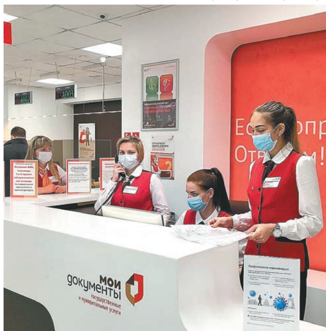
Пресс-служба МФЦ Пермского края