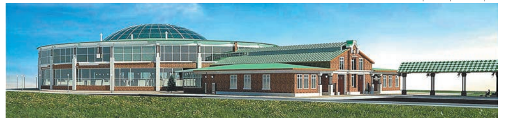
Минтранс Пермского края