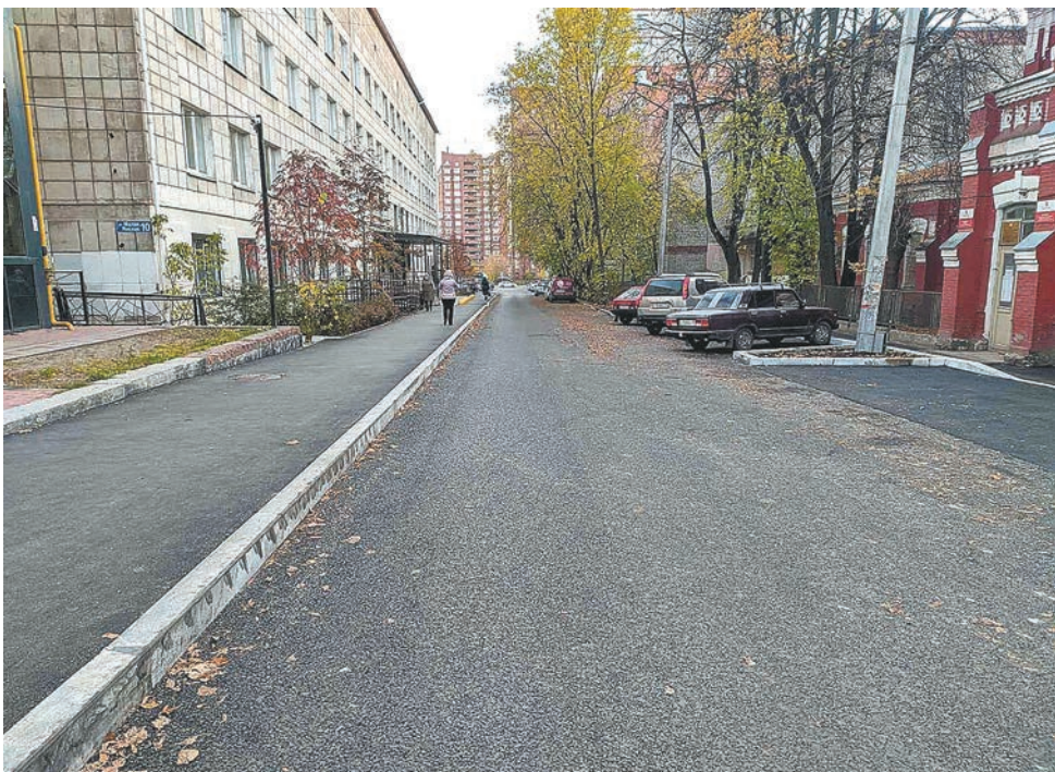
Ул. Малая Ямская

участка установили новые бортовые камни, обустраивают тротуары.