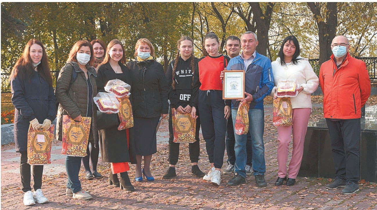
Вручение призов победителям творческого конкурса, посвящённого юбилею газеты «Пятница»

«Первоклашки сдали первый экзамен. 8900 пермских детишек из всех школ города впервые проходили тестирование. Как пояснили в городском комитете по образованию, «суперсложного» от первокурсников не требовали, задания были на уровне дошкольного образования, по русскому языку, математике и психологические тесты на общее развитие. Цель тестирования — мониторинг знаний и возможно-