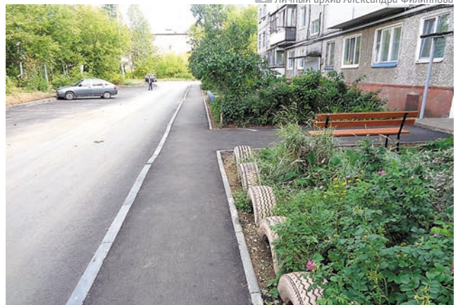
Двор дома на ул. Старикова, 9а