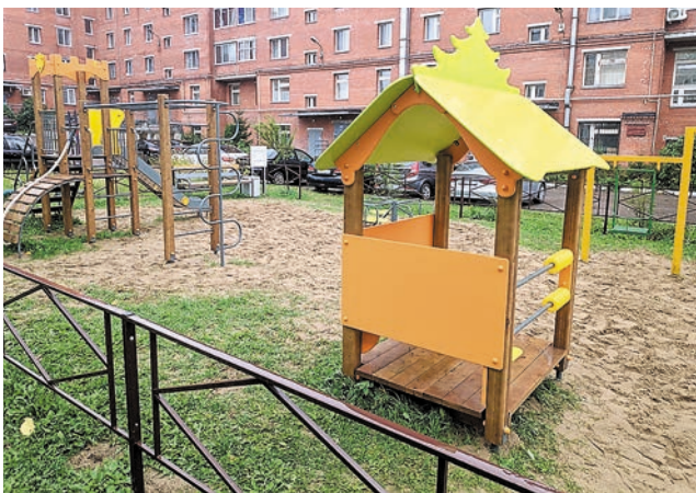
Детская площадка на ул. Менжинского, 15