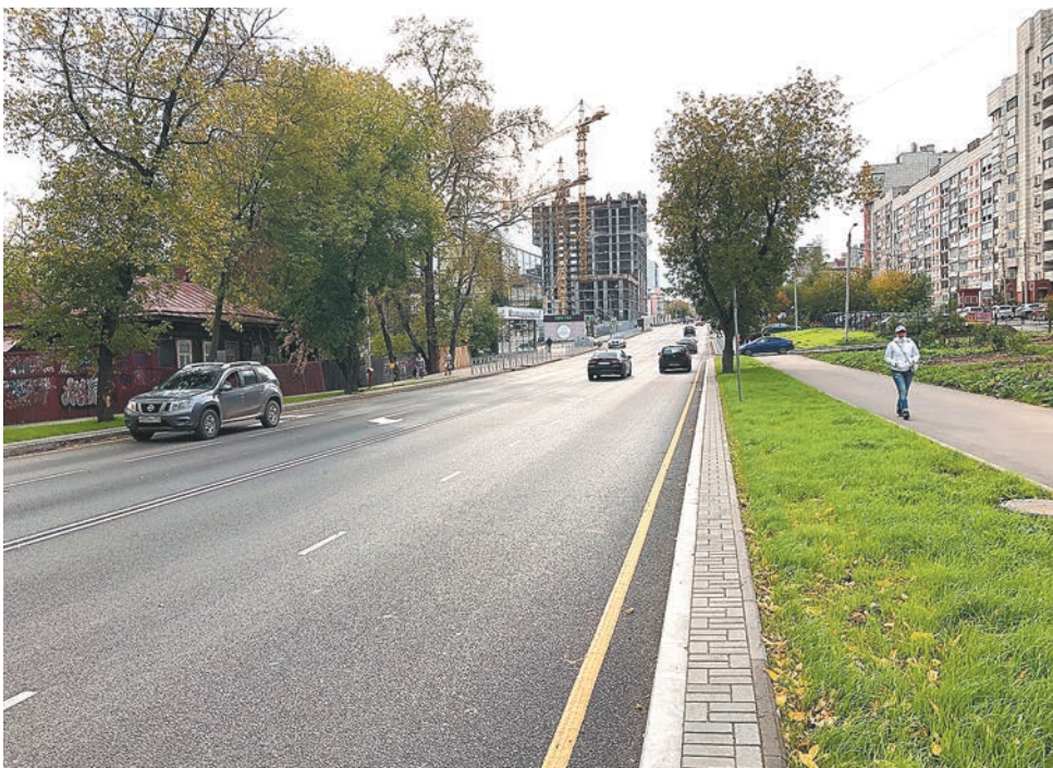
Улица Николая Островского

На сегодня в Перми по нацпроекту «БКАД» отремонтированы также улицы Петропавловская, Краснова и Красноуфимская. Всего в этом году в Пермском крае приведут в порядок 55 дорожных объектов: 35 основных и 20 — за счёт экономии от проведения весной конкурсных процедур. Нацпроект охватывает четыре муниципалитета Пермской городской агломерации: Пермь, Пермский район, Краснокамский и Добрянский городские округа. В настоящее время в эксплуатации приняты уже 14 дорог, на остальных основных объектах подрядные организации выполнили работы уже более чем на 80%. Также начался ремонт на объектах экономии. Все они будут готовы до конца текущего дорожного сезона.