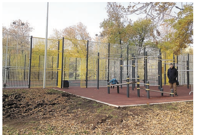
Спортплощадка за ДК им. Пушкина