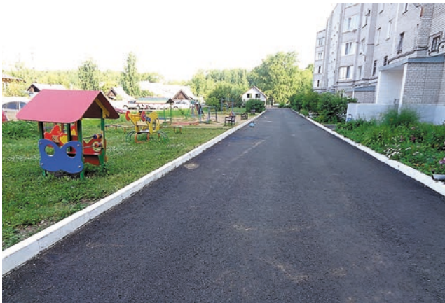
Дворовый проезд на ул. Щербакова, 46

Радуют глаз новые тротуары и дорожки. Отремонтирован подход к дому на ул. Краснозаводской, 56 со стороны лесного массива в микрорайоне Январском, обустроен мостик через ручей. Заканчивается обустройство подходов к остановке