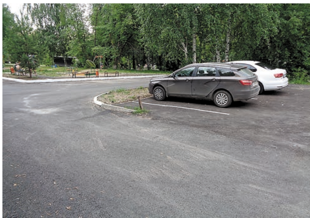
Двор дома на ул. Веденеева, 13

Наконец, ведутся работы по кронированию деревьев по заявкам жителей. Где-то деревья стали старыми и дряхлыми и угрожают безопасности людей — такие растения приходится убирать совсем. Часть работ по кронированию провели весной, до ноября будет выполнен ещё ряд заявок. Сумма выделенных на эти цели средств весомая — более 300 тыс. руб.