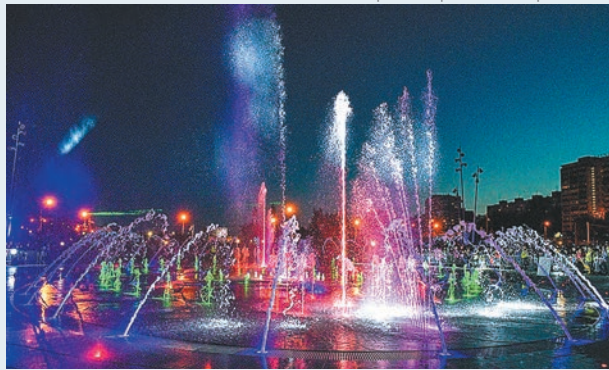
Театральный фонтан

Впереди предстоят работы по отключению и консервации фонтанов с чашей.