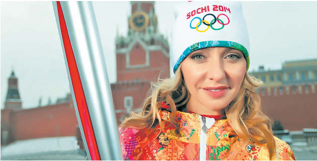
Татьяна Навка — посол Олимпиады-2014

до 11 апреля 2013 года в офисах страховщика по всей стране. Правила конкурса и список офисов размещены на сайте sochi2014.ingos.ru . В Перми заявки принимаются по адресам: ул. Ленина, 58а, ул. Ленина, 9, ул. Островского, 64. Жители Чайковского могут обратиться в офис компании по адресу: ул. Ленина, 61а. Телефон для справок 8 (495) 956-55-55. Принять участие в отборе может каждый россиянин или человек, находящийся временно