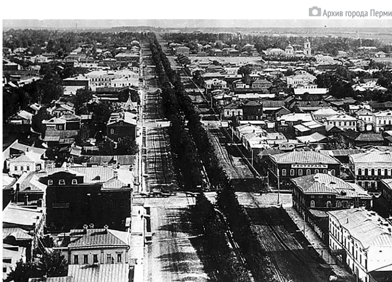
Старый вид Перми из сборника «Пермские градоначальники»