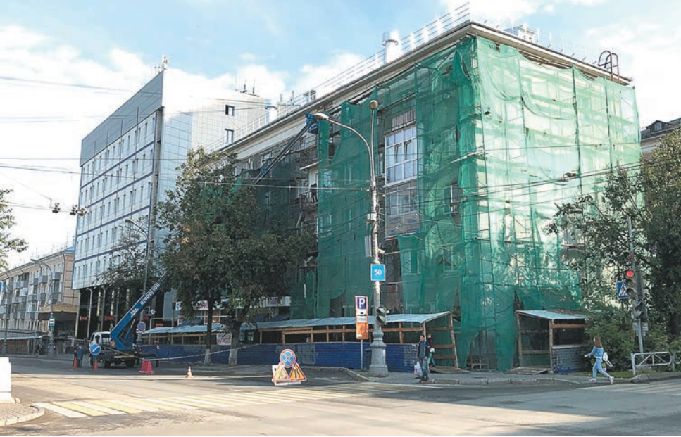
Комсомольский проспект, 40

За 2020 год фонд уже направил на оплату услуг более 978 млн руб. В настоящее время работы ведутся с финансированием в 2,6 млрд руб. Также проходят торги на проведение строительно-монтажных работ по капитальному ремонту на 730 млн руб.