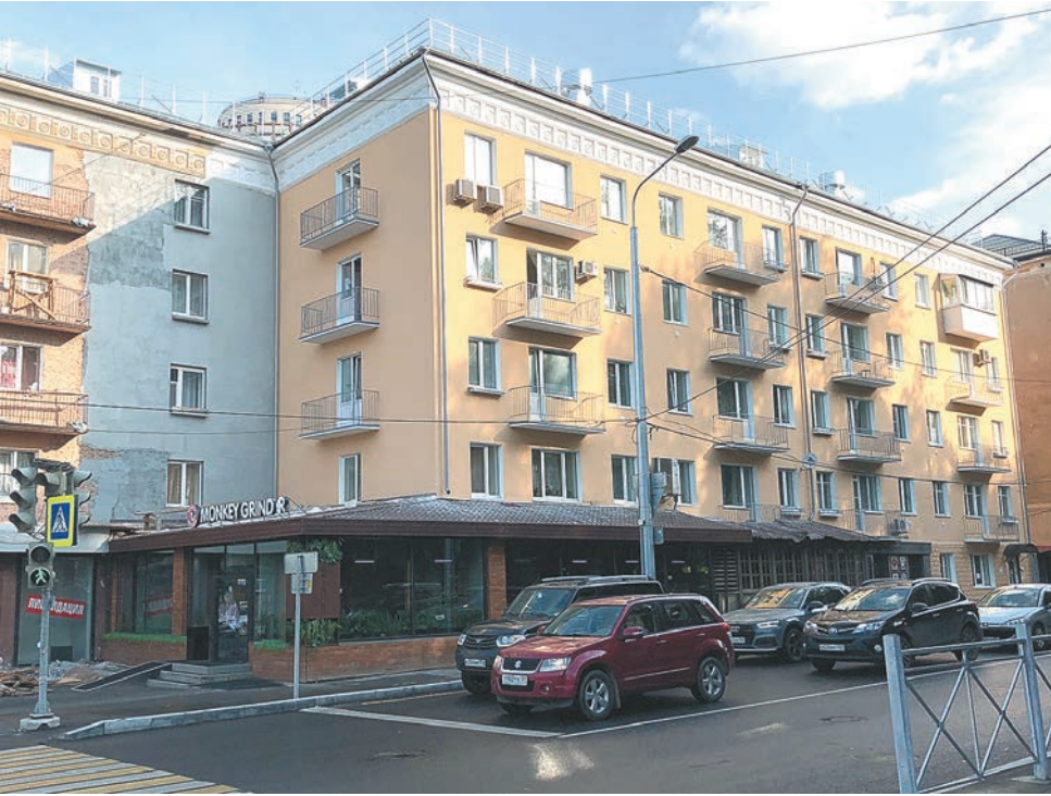
Комсомольский проспект, 44 и ул. Краснова, 26