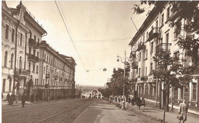
Архив города Перми