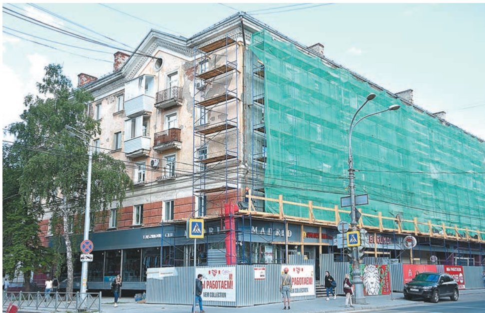
Комсомольский проспект, 58