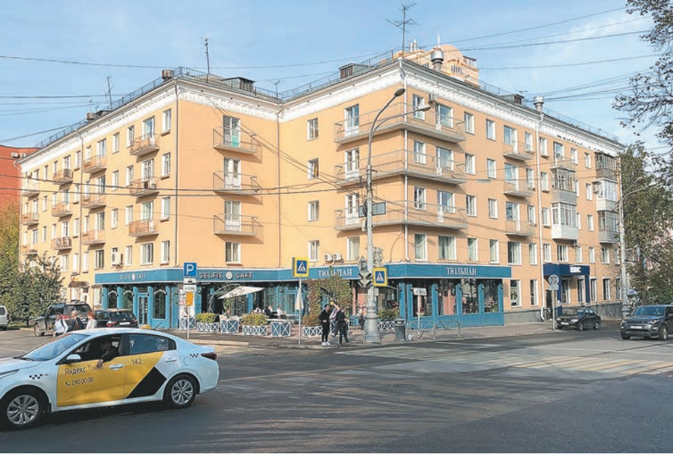
Ул. Краснова, 28 и Комсомольский проспект, 41