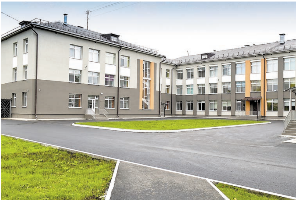
Школа №127 после капитального ремонта

чалось строительство нового корпуса школы на ул. Юнг Прикамья, ведётся реконструкция здания на ул. Целинной для размещения в нём школы, продолжается строительство нового корпуса школы №93. В ближайшей перспективе планируется реконструкция школы №22, строительство нового корпуса гимназии №17.